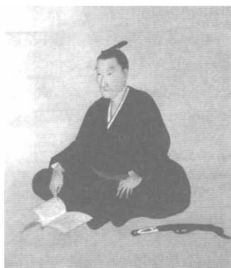
1850年代吉田松陰即鼓吹侵略台灣