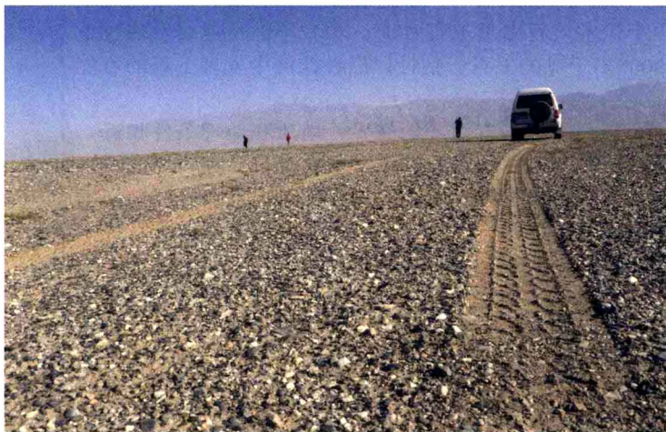
若羌县和田戈壁玉出产地。