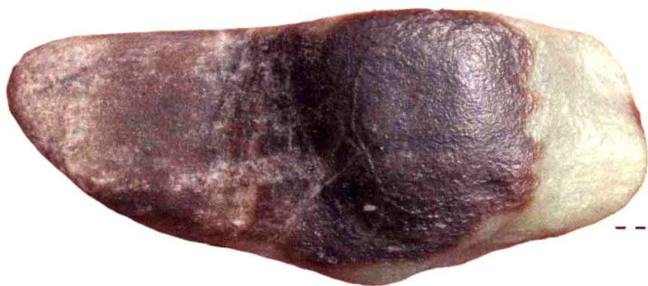
且末带糖色的戈壁玉。

吨，其中一级料约15%，是供应全国白玉、青白玉的生产基地。从1973年建矿到2002年的30年时间里，采玉达2870吨。