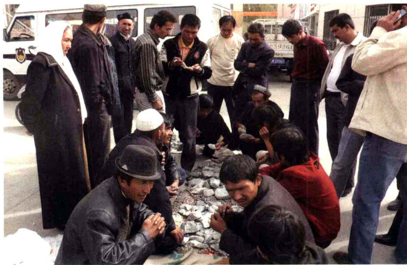
且末玉石巴扎的玉石主要还是以山料为主。

新中国成立后，且末加强了对昆仑山、阿尔金山一带玉石矿资源的勘探开发。特别是改革开放以来，随着阿尔金山一带玉石矿的相继发现，且末的玉石产量则呈上升趋势，玉石的开采、加工、销售有了长足的发展。据调查资料显示，20世纪80年代，全疆每年计划开采和田玉25吨左右，而且末就占到了21吨左右。到了90年代，且末和田玉产量占全疆总产量的七成以上，平均年产和田玉玉石原料约80~150