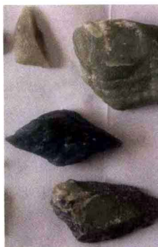
若羌出产的 各种戈壁玉。

由于若羌与哈密这个新疆最大的奇石产地交界，地质和地理条件相近，若羌县除了玉石资源外，还具有丰富的奇石资源。主要奇石品种有风凌石、泥石、玛瑙、彩玉和一些图纹石，特别是风凌石资源比较丰富，是目前新疆奇石市场的主要品种。在瓦石峡乡、米兰镇、米兰桥等地的戈壁滩发现了四五处风凌石产地。据我所知早在2005年就有哈密、鄯善的探石人在若羌县境内捡石，特别是2006年9月在若羌和敦煌交界的东北部沙漠地区，发现了新疆迄今为止分布面积最大、质量最好的玉质风凌石，若羌是近几年新疆奇石市场风凌石的主要来源地，部分精品在内地奇石市场以几十万元成交，直到2010年仍然在开发。若羌未来将是新疆大漠石资源开发的最后一块宝地。