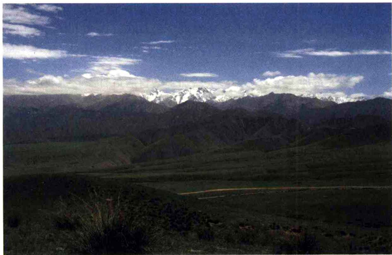
于田县境内昆仑山脉中段的喀什塔什山，被当地人称为“群玉之山”，这里是历史上一处重要的和田玉产地。

于田县境内昆仑山脉中段的喀什塔什塔格，就被当地人称为“群玉之山”，这里是历史上一处重要的和田玉产地，开采的矿点有四五处。在这里从克里雅河到柳什河，以阿拉玛斯为中心长十余千米、宽100~200米的地段，有包括阿拉玛斯玉矿床、冰斗河玉矿、赛迪库拉木、依格浪古玉矿床等几处矿床及矿点。比较著名的