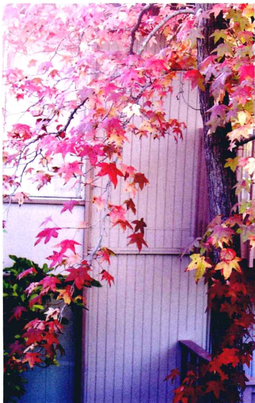
像是仙女披着一件淡紫色的纱巾

树叶像一团团火焰，慢慢燃烧在蓝天里影。我沿道路一转，眼前出现一排枫树，让我惊叹。这些枫树的树叶像一团团火焰，慢慢燃烧在蓝天里，似乎要给萧萧的冬日增添点温暖。再往前走，却是另一番景象。一排高大的枫树，在道旁威武地耸立着，好像固若金汤的铜墙铁壁，发出战斗的呼唤，使人立即勇气倍增，竟怀疑自己已成为西班牙的斗牛了。在不远的山坡上，草木还不愿卸下绿色的盛装，几棵枫树却已红得发紫。色彩如此凝重，真像一幅出自名家手笔的油画。说起看红叶，人们自然会想起北京西山和加拿大，况且门罗帕克地处加州湾区，气候温和，怎么也想不到会有如此激动人心的枫树景观。我立即匆匆回到住处拿相机，要抓住时机拍摄下这红叶的风姿。