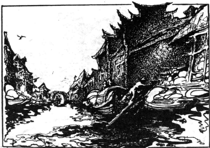
1. 万盛米行的河码头，横七竖八停泊着乡村里出来的敞口船。