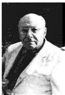
勒内·阿帕德·斯皮茨 (René Árpád Spitz, 1887~1974)

勒内·斯皮茨的精神、思想及其表现形式都是他留给后人的宝贵遗产，他为后人提供了一个有效、准确且富有创见的理论模型。无论是现在还是将来，其理论对于儿童心理学的发展都有着持续的推动作用。