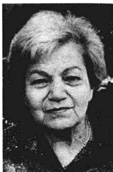
玛格丽特·舍恩伯格·玛勒 (Margaret Schoenberger Mahler, 1897~1985)

玛勒的理论嫁接了传统驱力理论、自我心理学派、客体关系学派和自体心理学派，在现代精神分析的学派纷争中，以其构架性、连绵性、延展性而闪耀出特别的光芒。