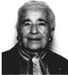
艾迪斯·雅可布森 (Edith Jacobson, 1897~1978)

雅可布森为精神分析作出的最大贡献就是她关于整合性的心理发展和心理结构模式，不仅包括自我理论和客体关系理论，还为整个精神病理学和正常发展范围的精神分析理解提供了一个清晰而又宽泛的参考框架。