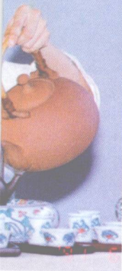
↓ 安溪工夫茶茶艺表演