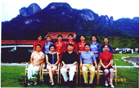
↑作者与红袍公司第六届茶艺培训班学员合影。