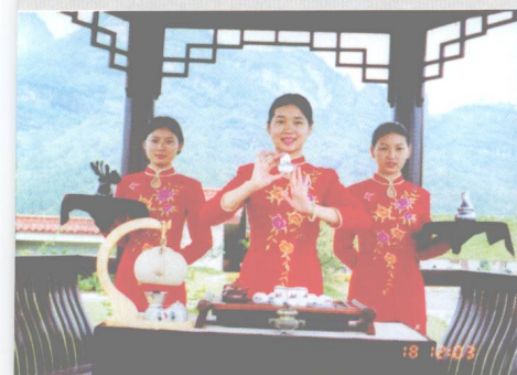
↑武夷山红袍公司工夫茶茶艺表演