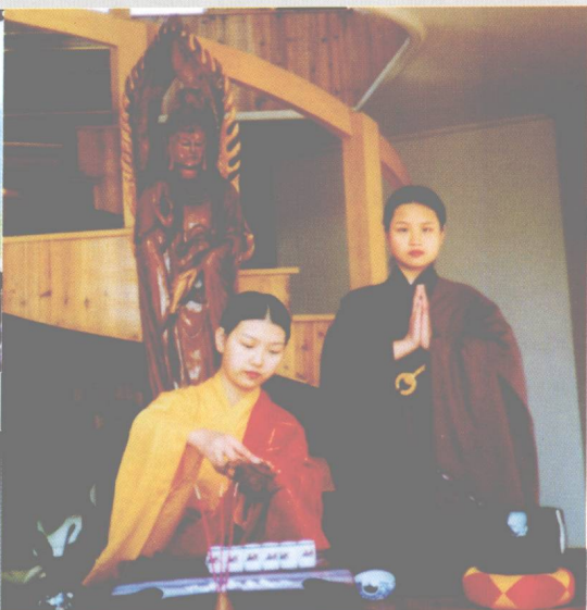
↑武夷山红袍公司禅茶表演