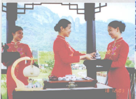
↑武夷山红袍公司工夫茶茶艺表演