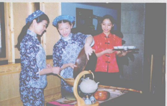
↑武夷山红袍公司擂茶茶艺表演