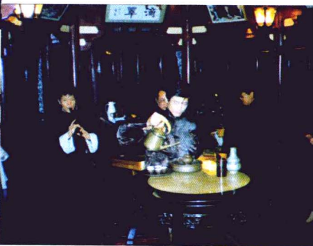
↑上海湖心亭茶艺馆茶艺表演。