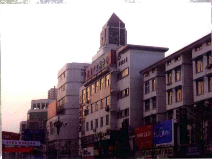
晨曦中的邮政大钟楼