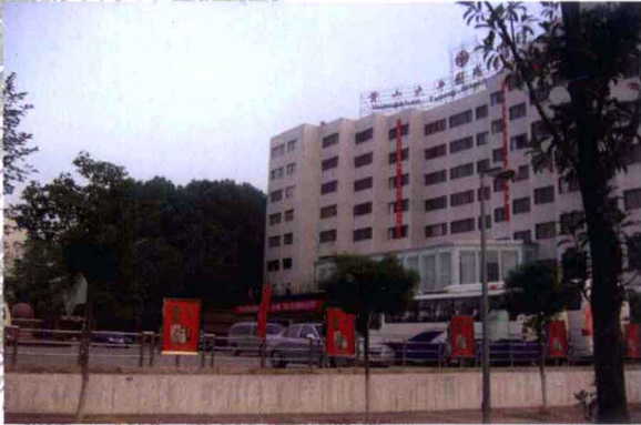
黄山太平国际大酒店