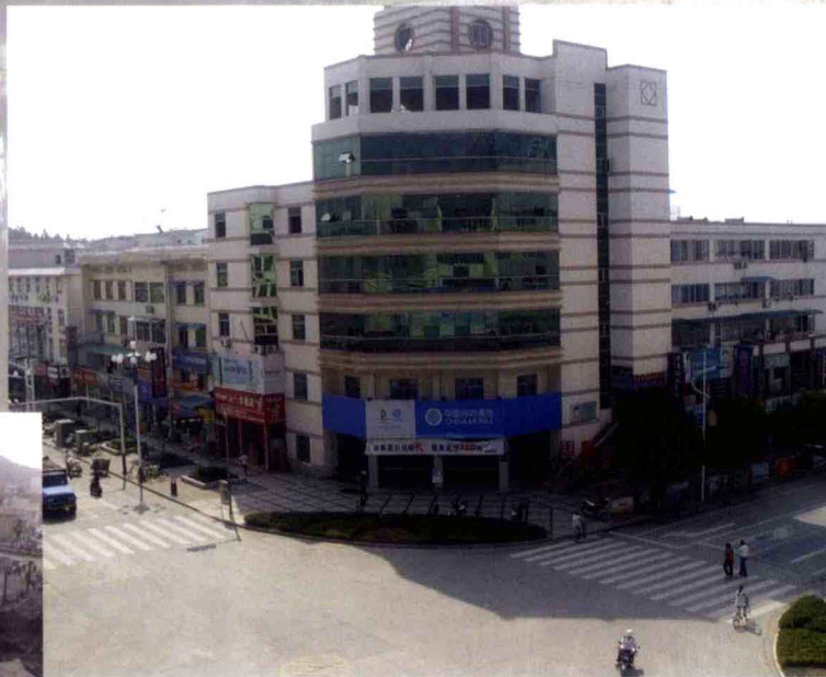
北海路、平湖路交叉口