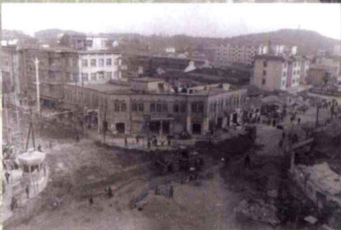
改造前的北海路口