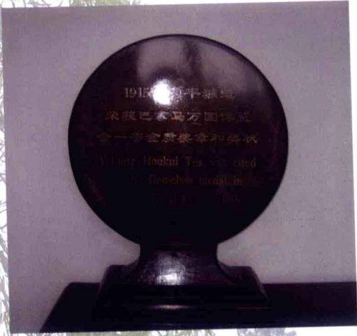
太平猴魁名茶万国博览会奖牌