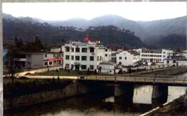
永丰乡党委政府大楼