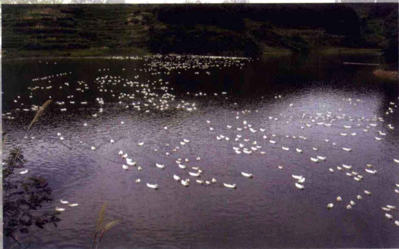
岸口里水库立体养殖