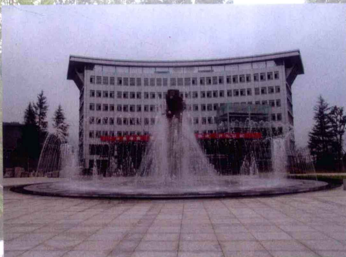
招商引资企业——新医药业有限公司