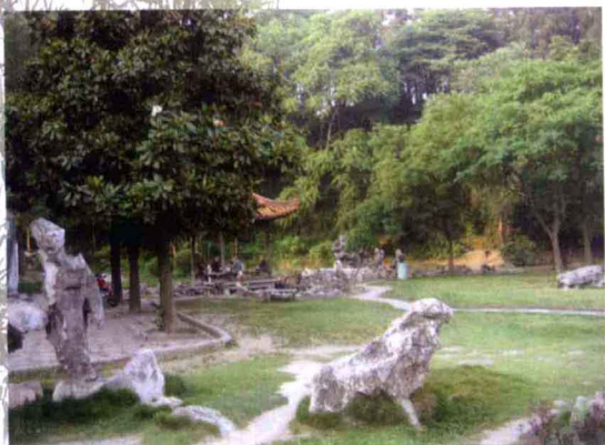
平湖广场幽雅的休憩园