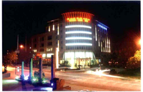
黄山地平线大酒店