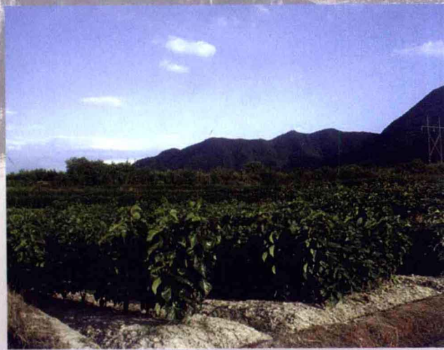
新丰高产优质桑园基地