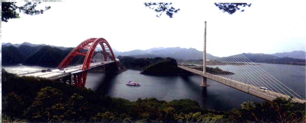
太平湖双桥雄姿(右为 103 省道大桥,左为高速公路大桥)