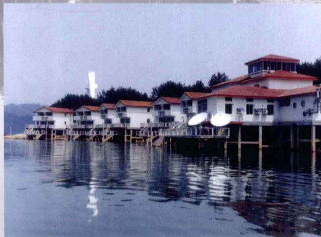
太平湖白鹭洲宾馆