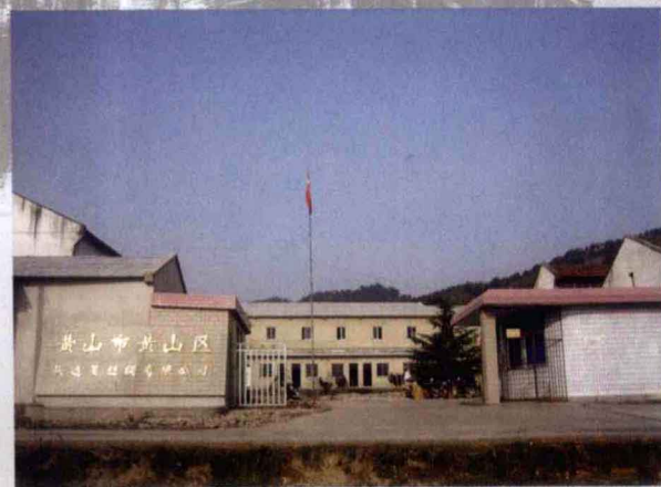
民营工业企业——新丰兴达茧丝绸有限公司