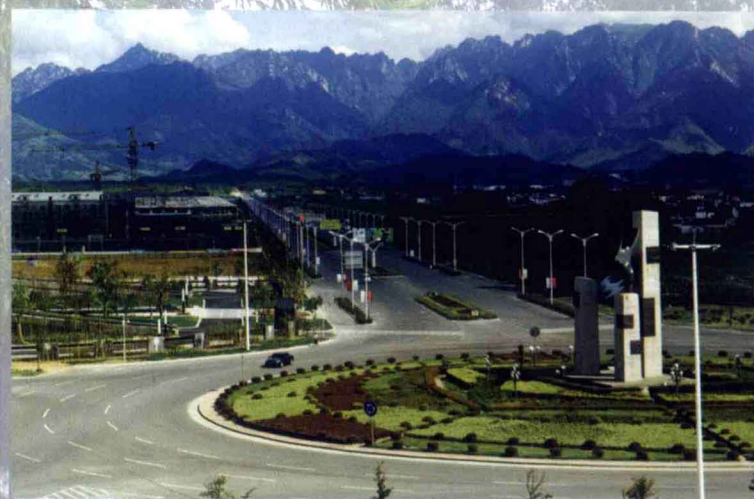
城区连接黄山的金鼎大道