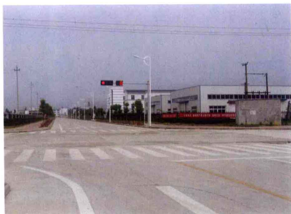
黄山工业园区一角