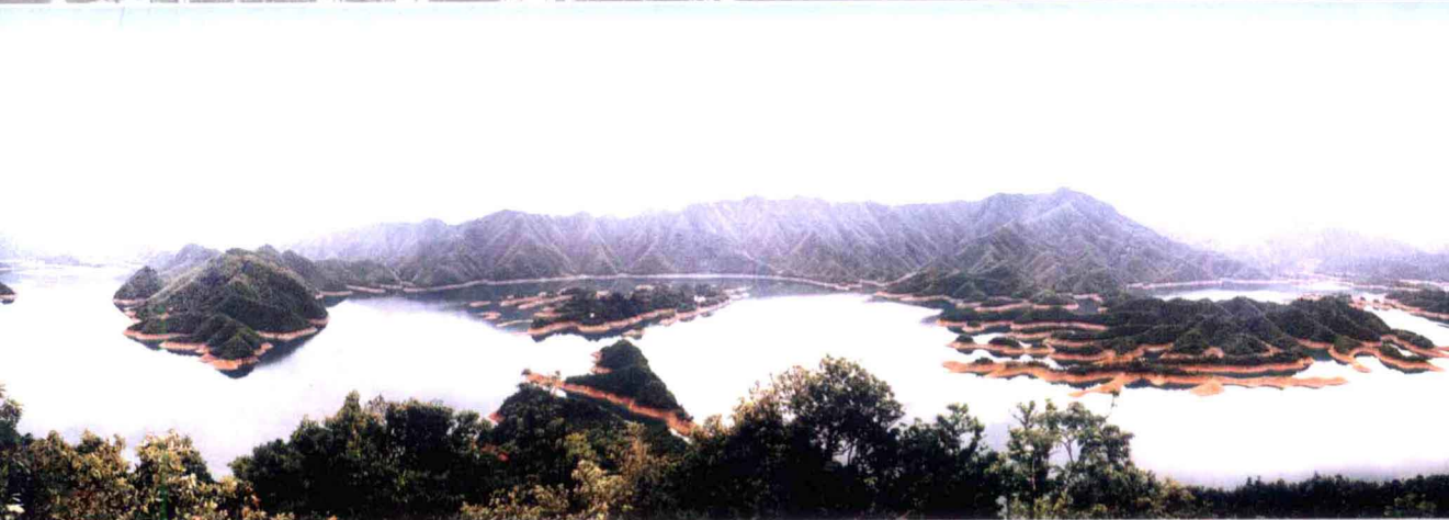
太 平 湖