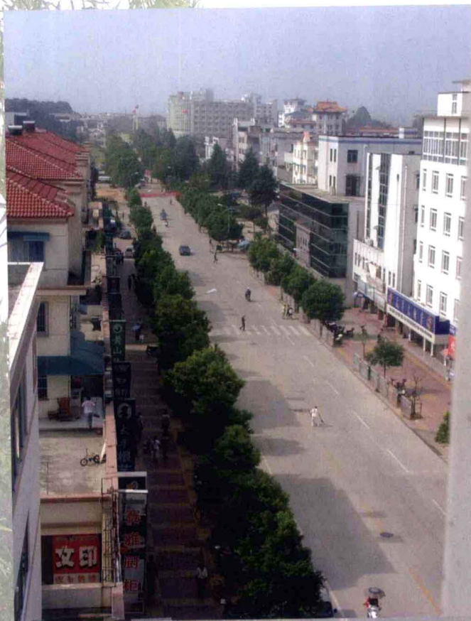
欣欣向荣的城区一角