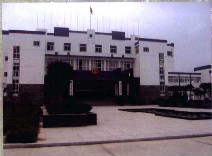
甘棠镇党委政府大楼