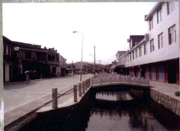
三口镇集镇建设新貌