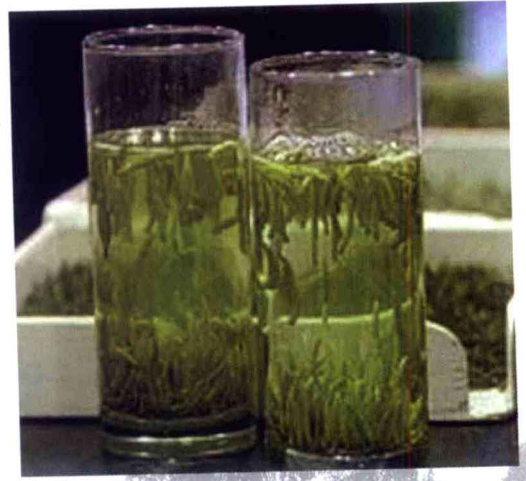
冲泡后的太平猴魁