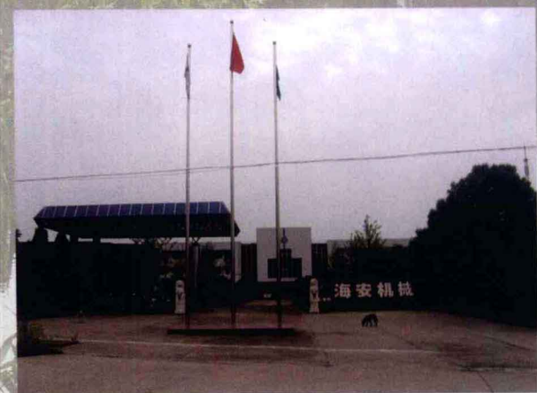
民营工业企业——海安机械制造有限公司