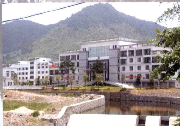
太平湖镇党委政府大楼