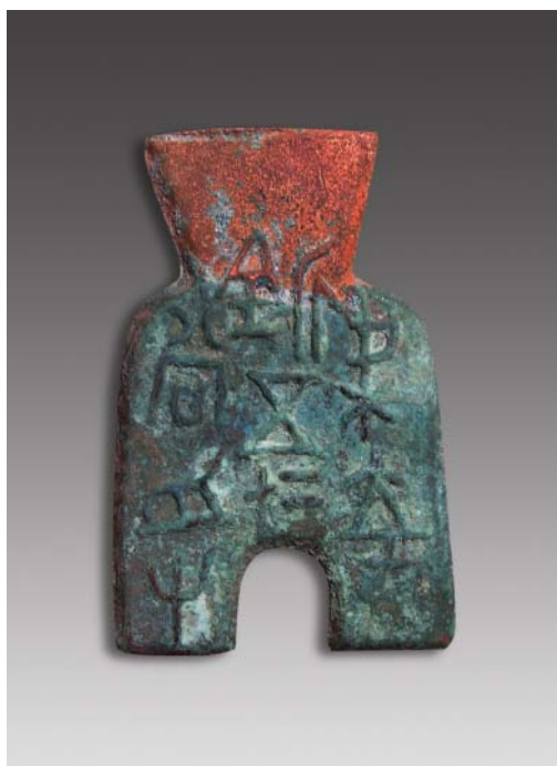
战国“梁充新五十二当镔”单面平首桥足布