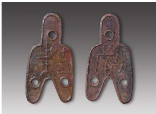
“平台”小三孔布（背十二朱） 高：8.3厘米 重：6.86克 估价：300,000元（RMB）