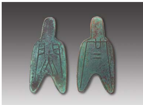
“蕮”圆足布（背廿二） 高：7.3厘米 重：16.18克 估价：18,000元（RMB）