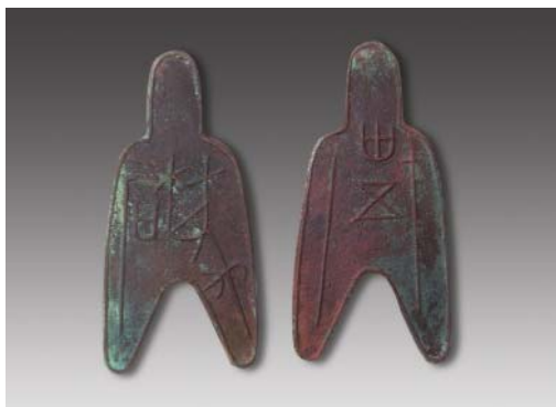
“离石”圆足布（背卅五） 高：7.7厘米 重：13.19克 估价：18,000元（RMB）