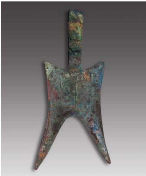
战国“甘丹”耸肩空首尖足布