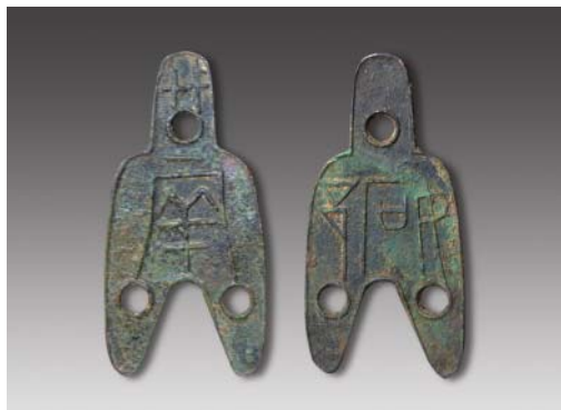
“拓邑”三孔布（背一两） 高：7.1厘米 重：15.88克 估价：400,000元（RMB）