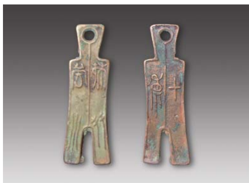
楚“殊布当釿”（背十货） 高：8.3厘米 重：24.01克 估价：20,000元（RMB）