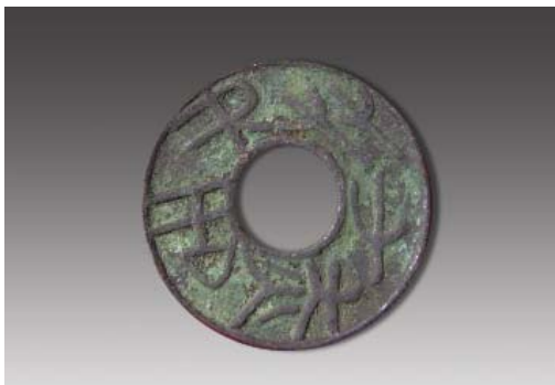
战国“共屯赤金”圆钱