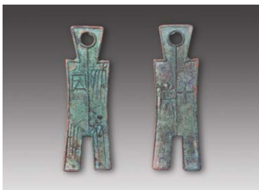
楚“殊布当釿”（背十货） 高：9.3厘米 重：36.38克 估价：20,000元（RMB）