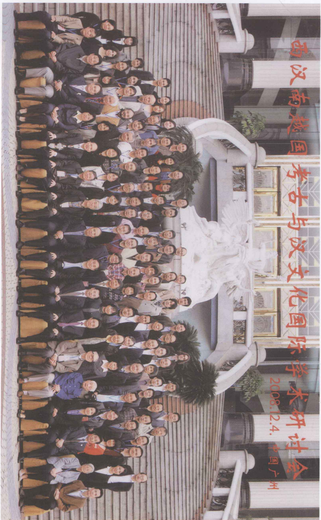
西汉南越国考古与汉文化国际学术研讨会全体人员合影