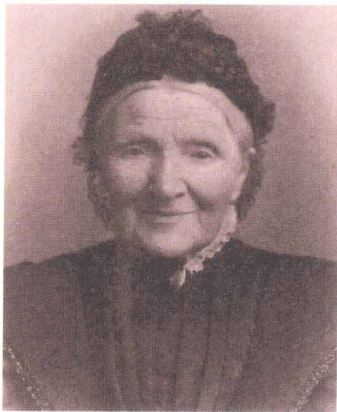
梵高的母亲安娜·柯尼莉亚

梵高父母双方的祖辈们都属于荷兰资产阶级世家。从那一时代无数的荷兰肖像画中常常可以见到这种人的形象：衣冠楚楚，表情木讷。他的父亲提奥多罗斯·梵高，是海牙牧师文森特·梵高所生的12个孩子中的一个。提奥多罗斯是荷兰喀尔文教派的牧师，为人笃实忠厚，