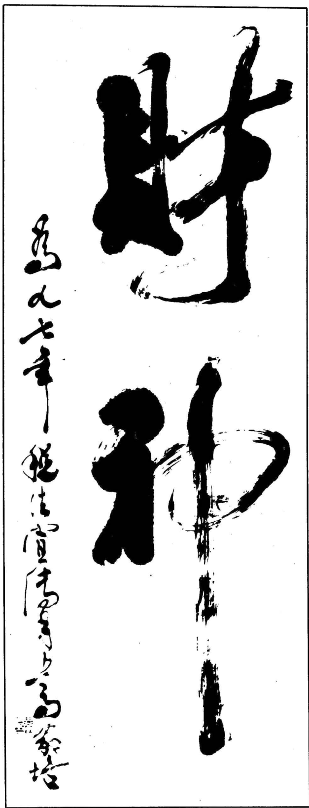
毕节地委委员、毕节市委书记 黄家培 书