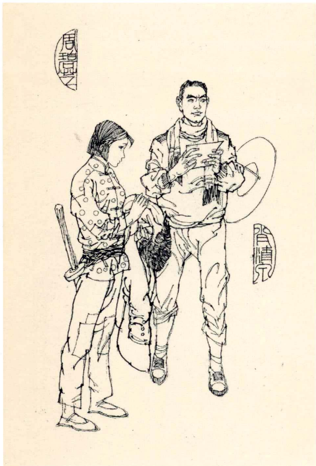
《囚锁在荒原上的爱》人物绣像 1987年