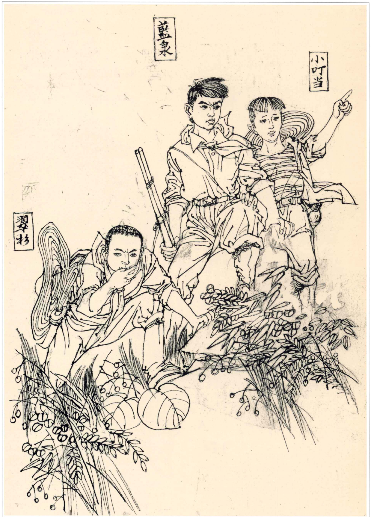
《呦呦鹿鸣》人物绣像 1997年