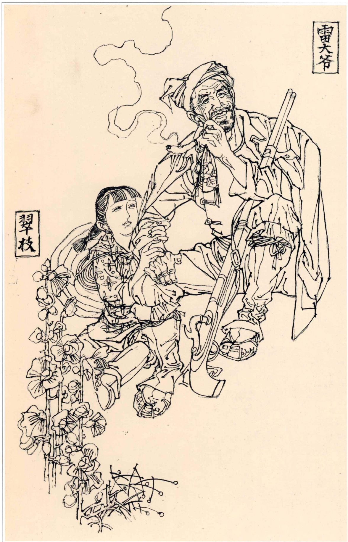
《呦呦鹿鸣》人物绣像 1997年