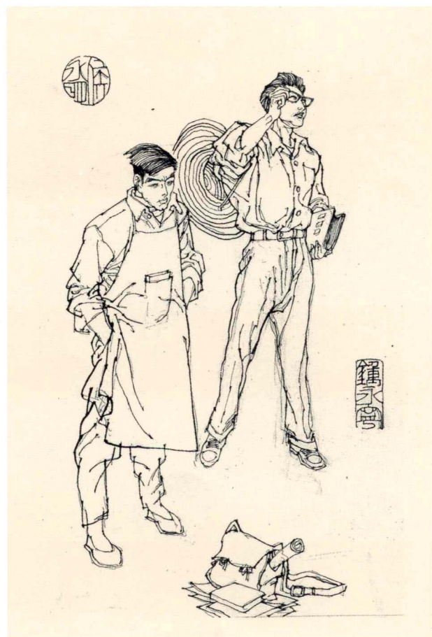
《囚锁在荒原上的爱》人物绣像 1987年