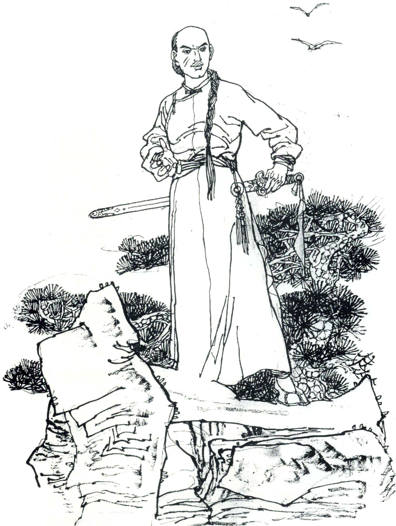
《七剑下天山》插图 1985年