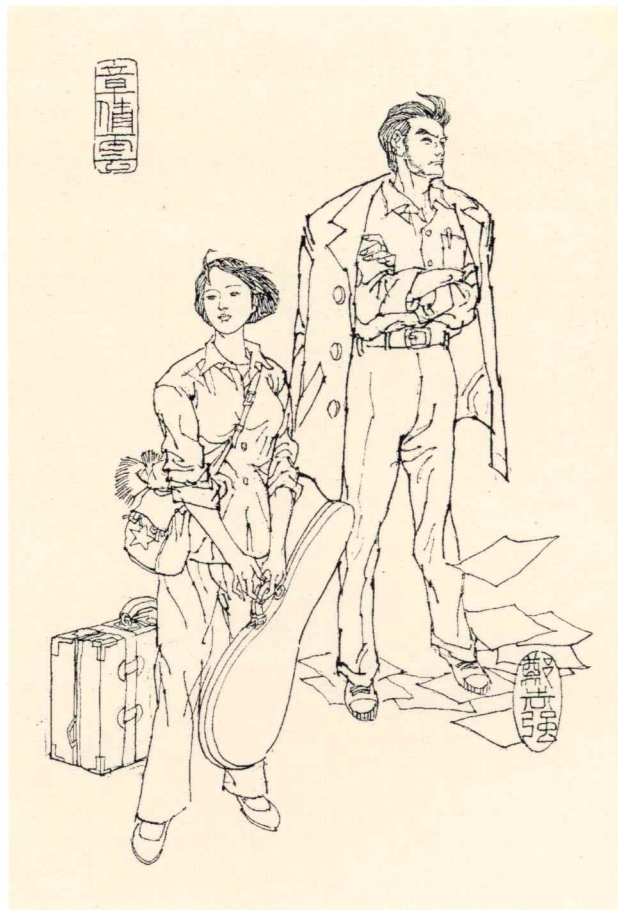
《囚锁在荒原上的爱》人物绣像 1987年