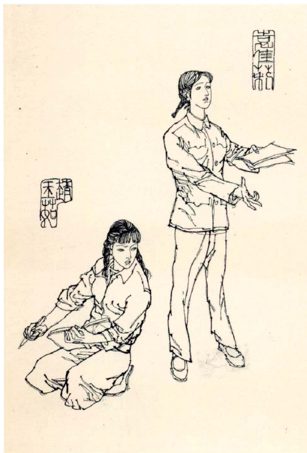
《囚锁在荒原上的爱》人物绣像 1987年