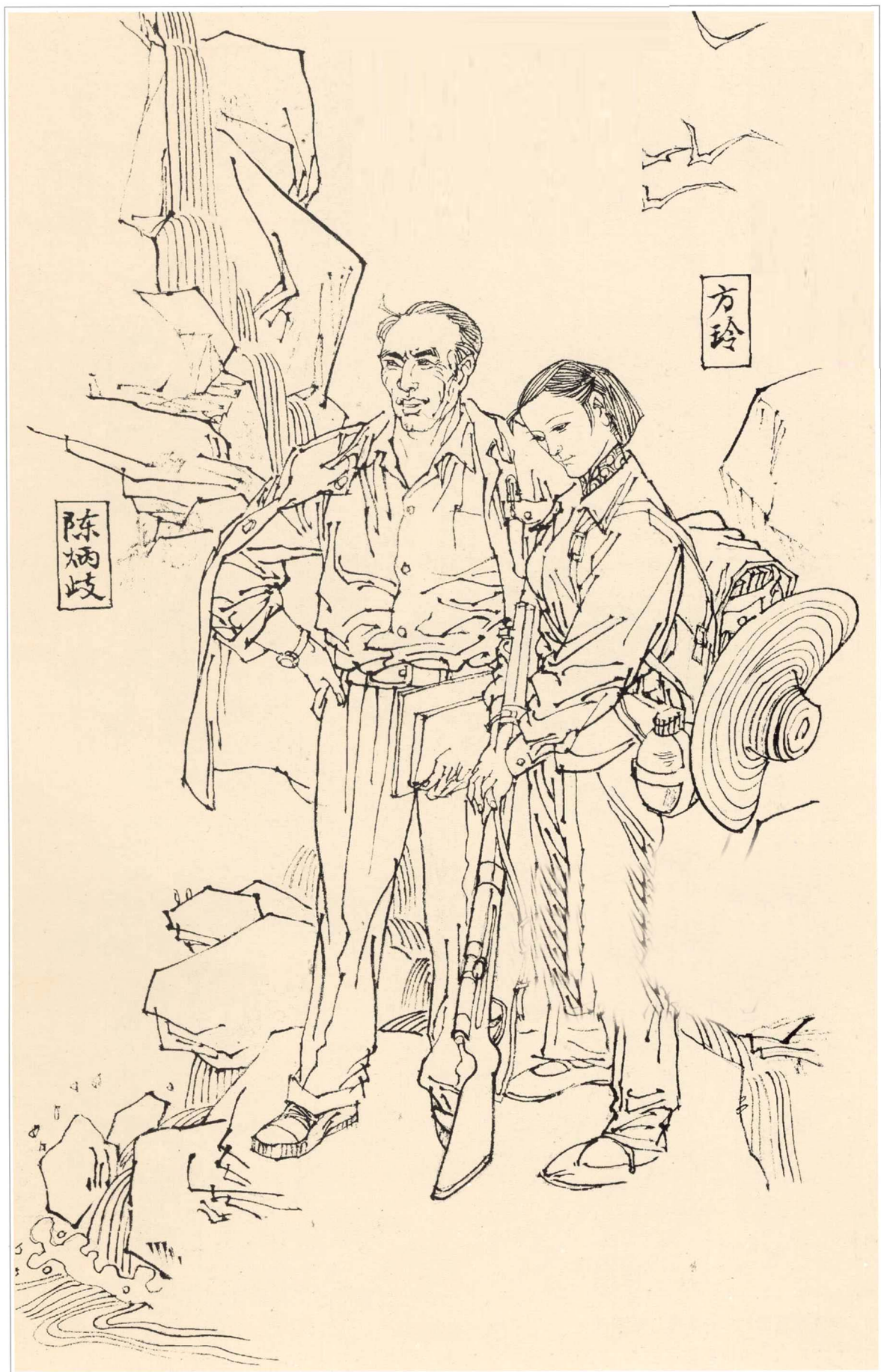
《呦呦鹿鸣》人物绣像 1997年