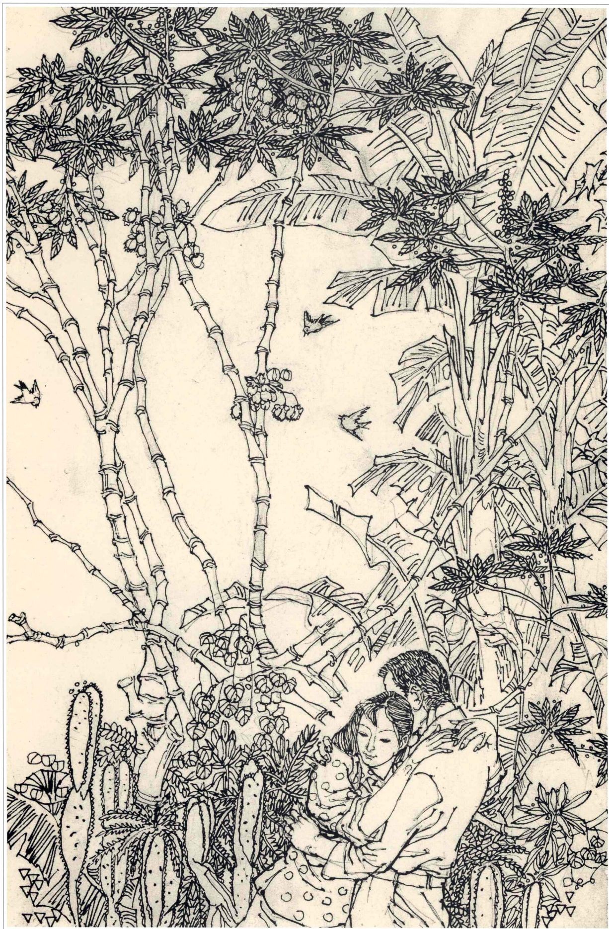
《囚锁在荒原上的爱》插图 1987年