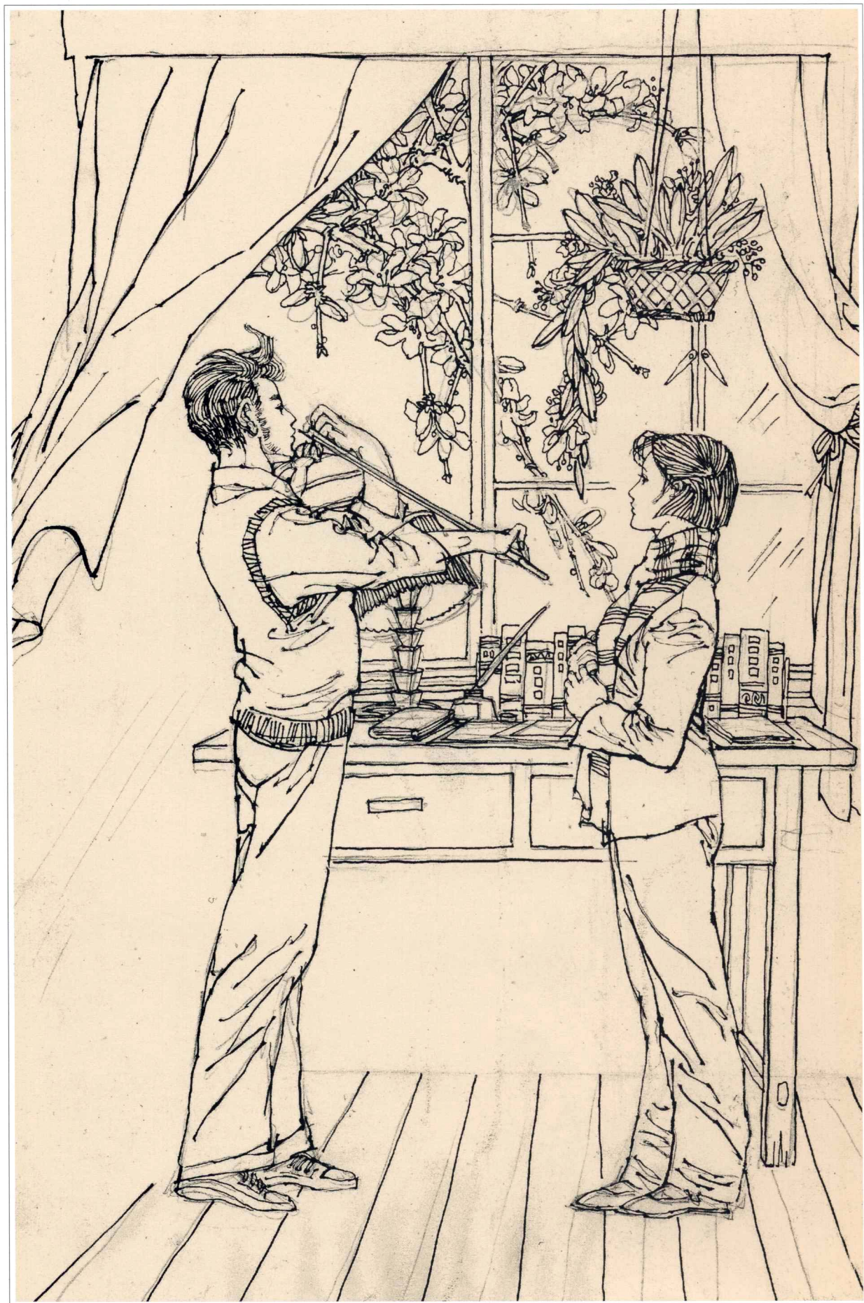
《囚锁在荒原上的爱》插图 1987年