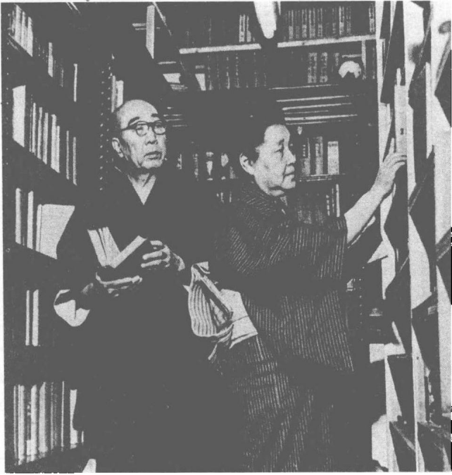
昭和三十七年（一九六二），乱步夫妇在自家土仓库图书室中。