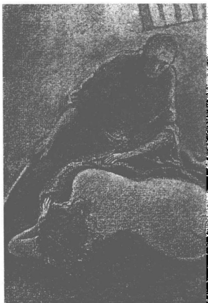
《阴兽》插画，竹中英太郎绘。