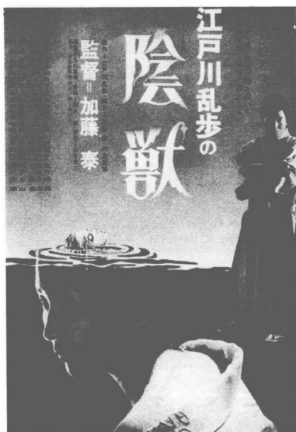
《阴兽》电影海报，拍摄于昭和五十二年（一九七七）。