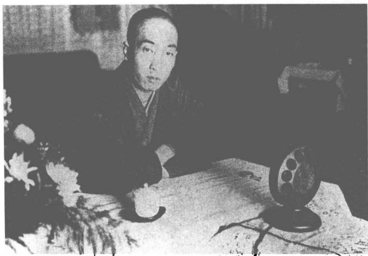
大正十五年（一九二六），乱步接受大阪广播局的邀请，做一个名叫“侦探趣味”的演讲。