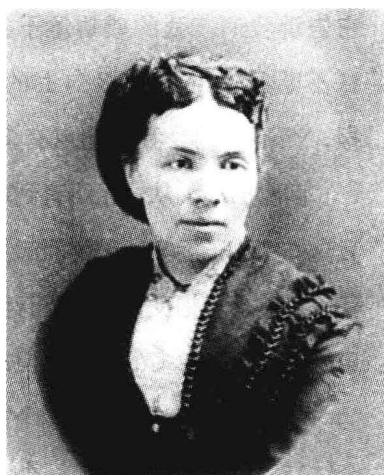
劳拉·斯皮尔曼·洛克菲勒，约翰·洛克菲勒的妻子、小约翰·洛克菲勒的母亲