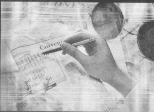
財務報表分析 Financial Statement Analysis