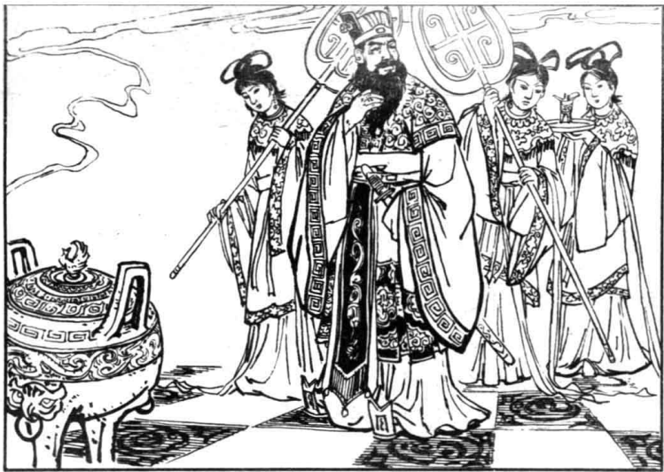
1. 汉朝末年，奸臣梁冀当权。