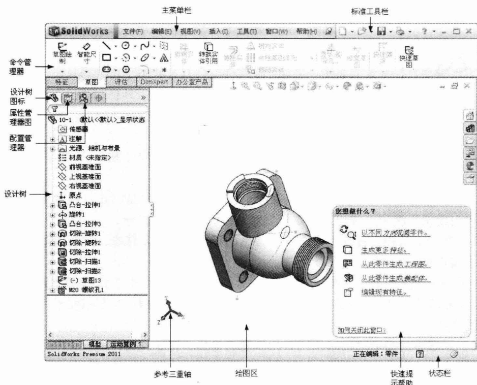
图1-1 SolidWorks 2011界面

(2) 标准工具栏：同其他标准的 Windows 程序一样，标准工具栏中的工具按钮用来对文件执行最基本的操作，如“新建”、“打开”、“保存”、“打印”等。