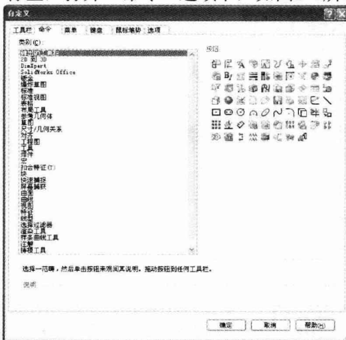
图1-3 “自定义”对话框的“命令”选项卡