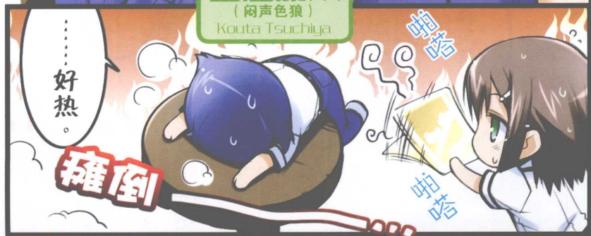
土屋康太 (闷声色狼) Kouta Tsuchiya