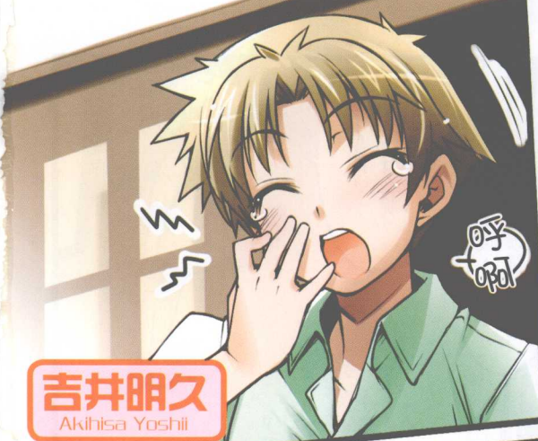
吉井明久 Akihisa Yoshii