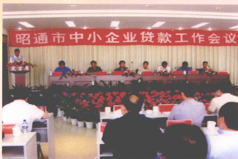
支持中小企业发展