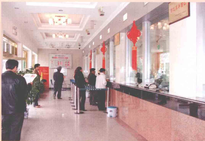
金融服务水平 指导银行机构提高