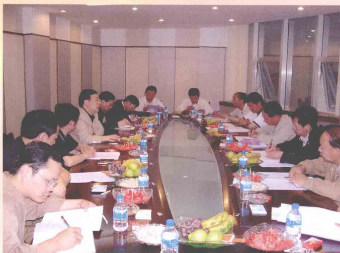
深入昭通基层调研 云南银监局李保上局长