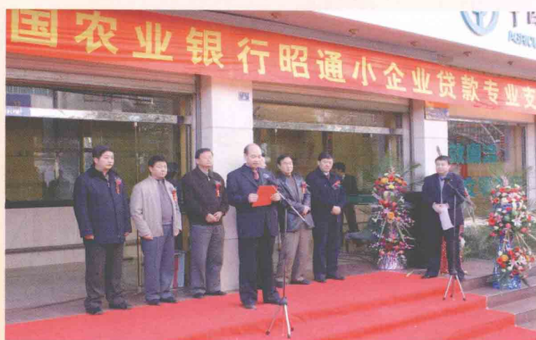
小企业贷款专业支行成立