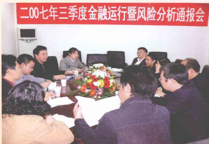
风险早知道，早防范