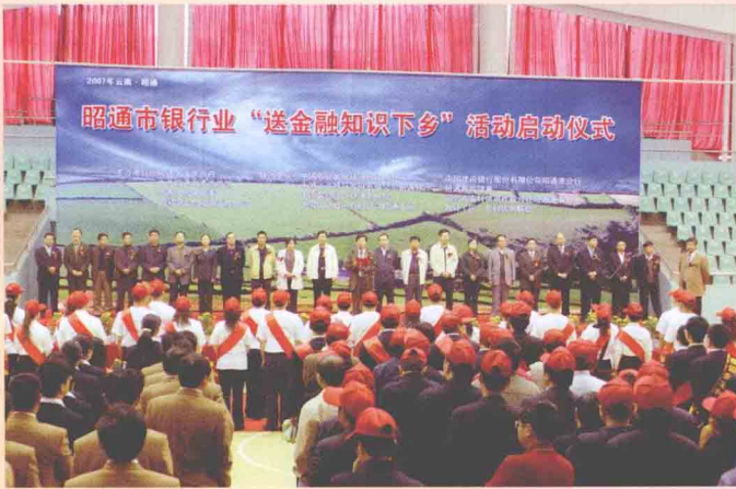
仪式上热情致辞 在『送金融知识下乡』活动启动 云南银监局副局长黄世安