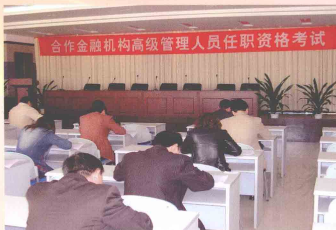
加强高级管理人员任职资格管理