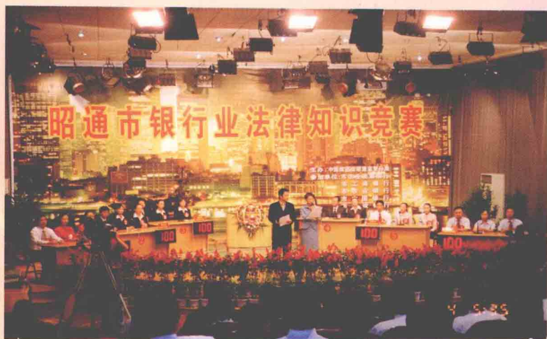
银行业依法经营 宣传法律知识，促进