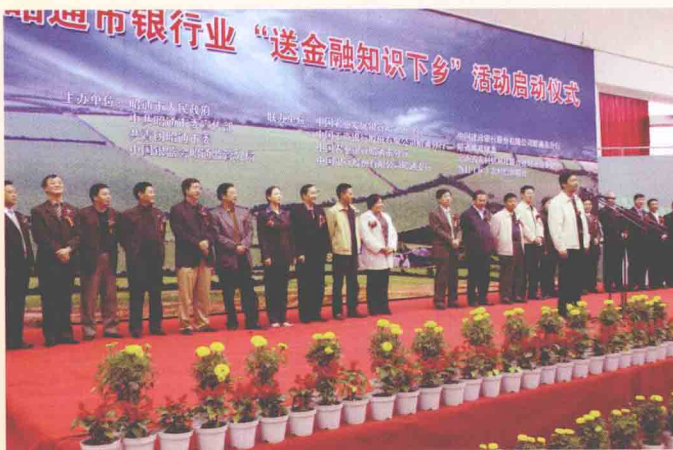
张纪华发布『送金融知识下乡』 昭通市委常委、市委秘书长