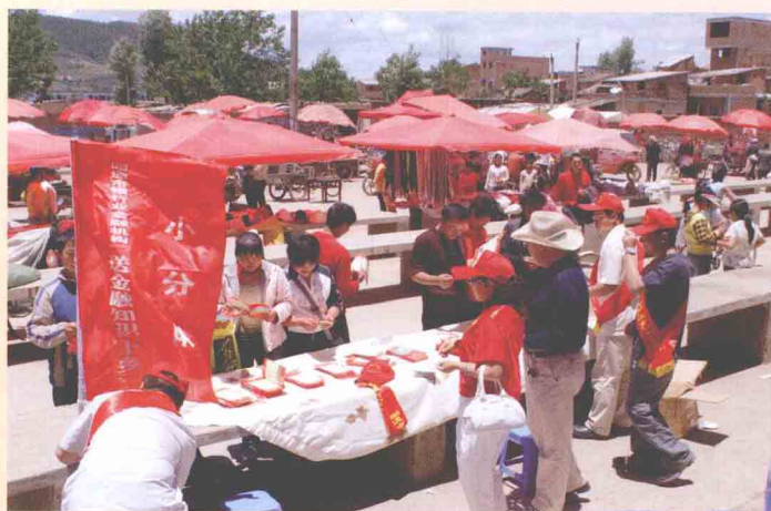
把金融知识送给广大民众