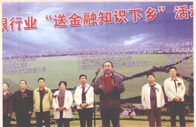
李勇信对『送金融知识下乡』活动寄予厚望 昭通市委常委、副市长