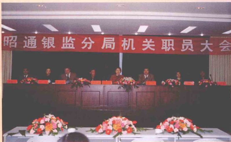
马驰指导银行监管工作 云南银监局副局长