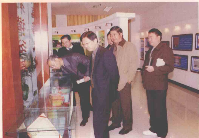
视察银监文化建设 云南银监局副局长黄世安