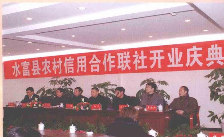
加强农村信用社产权改革