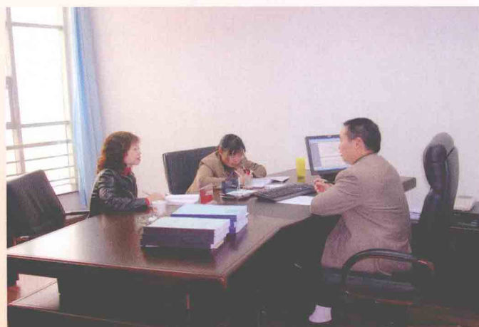
对高管人员约见谈话