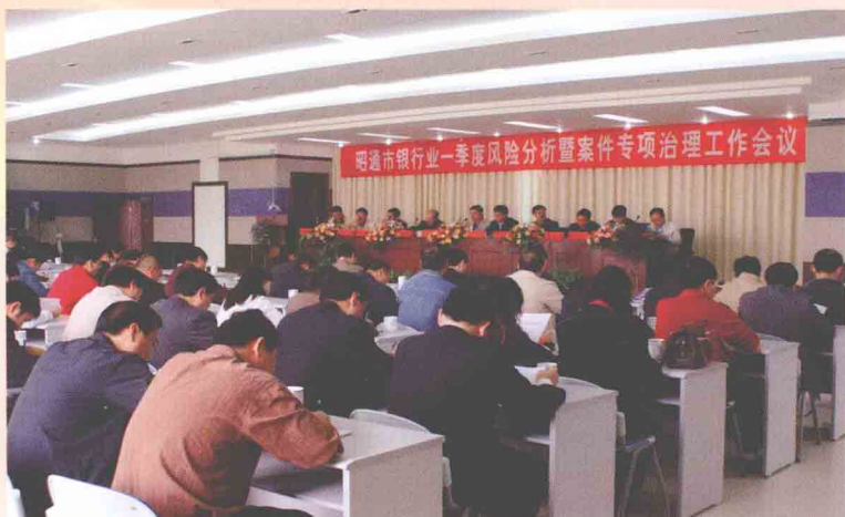
加强案件治理，确保银行安全运营