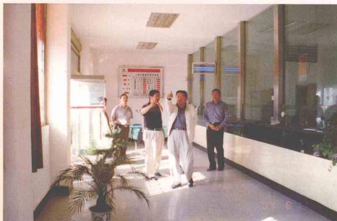
云南银监局原副局长彭志强 视察鲁甸地震灾区农村信用社