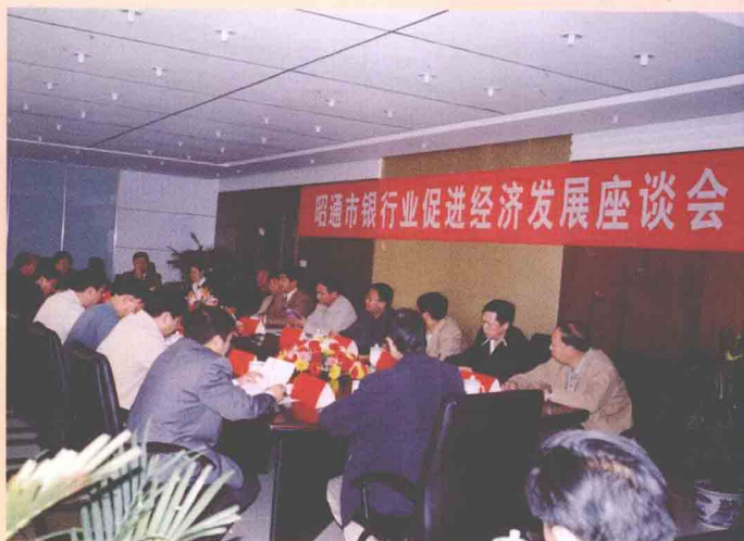
指导昭通银行业发展工作 云南银监局李保上局长