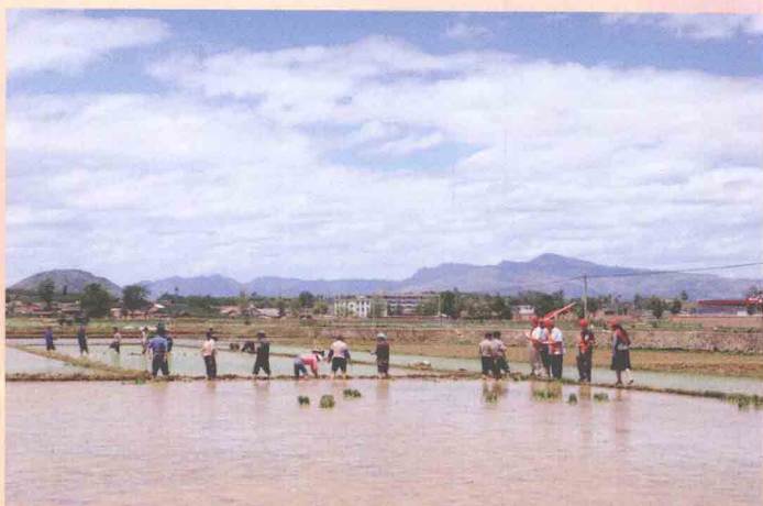
把金融知识送到田间地头