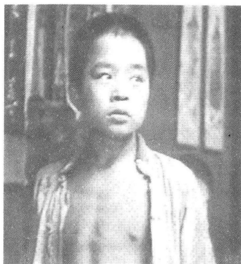
少年彭德怀心中有许多不平事