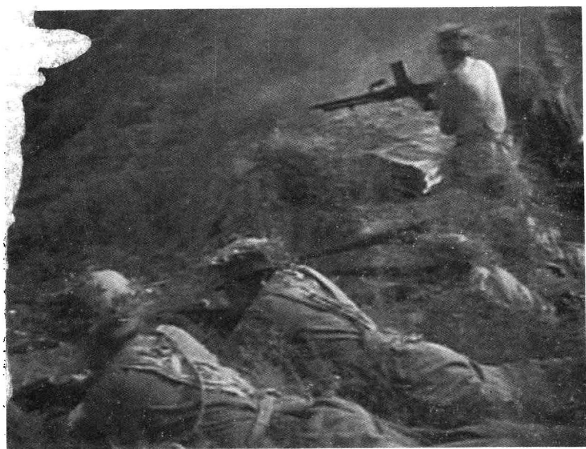
红五军士兵严阵以待