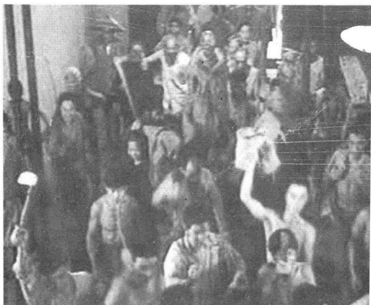
彭德怀与他秘密组织的“救贫会”