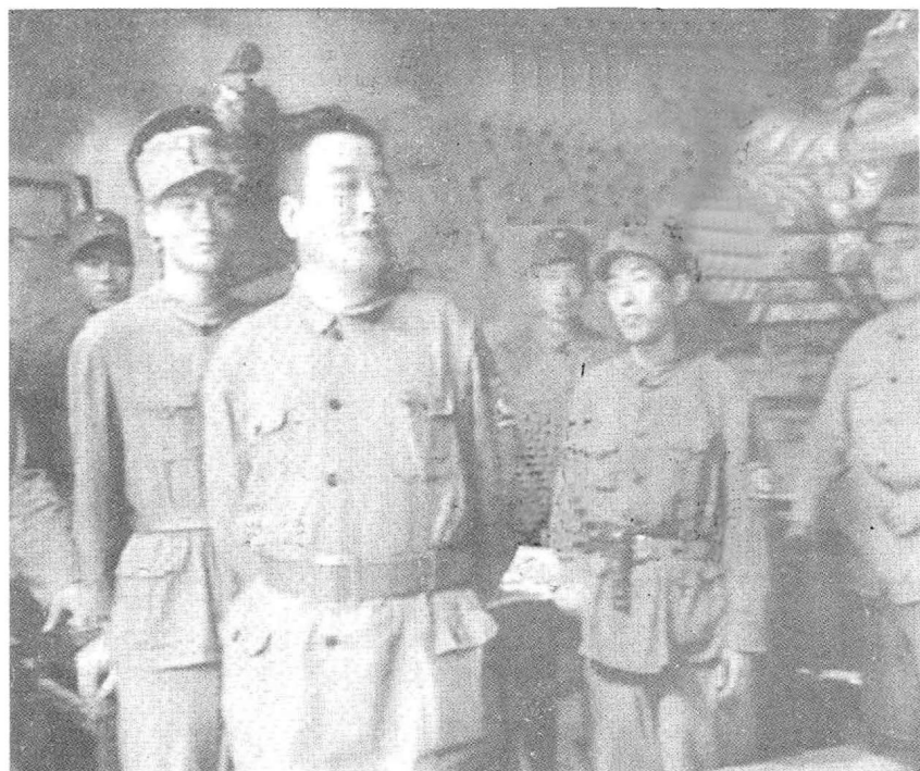
检查战备时的情景