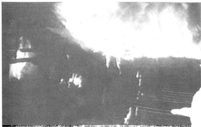
火烧黄碛岭煤窑时的情景