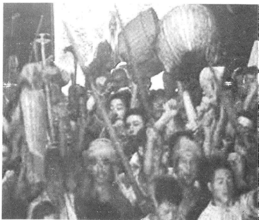
彭德怀带头逼地主交米