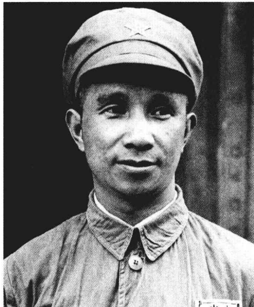
★ 粟 裕

四川乐至人。1919年赴法勤工俭学。1921年回国。1927年参加了南昌起义，任第11军25师73团政治指导员。土地革命战争时期，任工农革命军第1师党代表，红军第4军12师党代表、师长，红4军军委书记、军政治部主任，红6军、红3军政治委员，红22军军长等职。领导了南方三年游击战争。抗日战争时期，历任新四军第1支队司令员，江南指挥部、苏北指挥部指挥，新四军代军长。解放战争时期，任新四军军长兼山东军区司令员，华东军区司令员，华东野战军司令员兼政治委员，第三野战军司令员兼政治委员。1955年被授予元帅军衔。