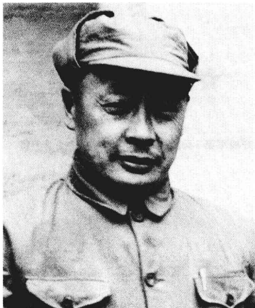
★ 陈 毅

第三野战军司令员兼政治委员陈毅、副司令员粟裕，第10兵团司令员叶飞，第二野战军第3兵团司令员陈锡联，第4兵团司令员兼政治委员陈赓，第5兵团司令员杨勇。