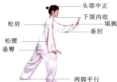
图 1-2-1 身体各部位姿势要领——搂膝拗步

(4) 松腰、垂臀、裹裆：太极拳的动作变化皆由腰腿转换发力，能松腰则重心稳定，动作运转轻灵。松腰要做到腰椎、腰两侧韧带和肌肉充分放松。突臀会造成腰部不能放松，所以应有意识地使臀部下垂，从身型上看不出突出的痕迹。裹裆是使两腿有向内包裹之意，膝关节与脚尖在一条垂线上，以达到裆要圆、圆