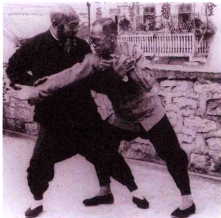
吴鉴泉示范捋劲的应用