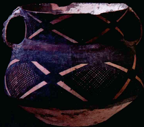
图1 彩绘 灰陶 菱格纹 双耳罐 马家窑文化马厂类型（前2350-前2050） 赛努奇博物馆藏