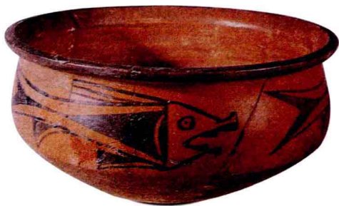
附图4 彩绘 鱼纹钵

尽管原始社会文化艺术还没有从图腾崇拜和巫术礼仪中独立出来，人们的审美意识还不那么清晰，然而，从仰韶文化半坡类型彩陶到马家窑文化马