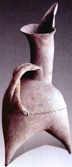
附图3 素面白陶 三足鬲（guī）