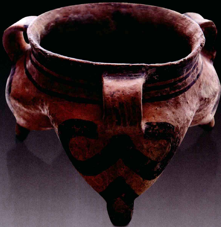
图3 彩绘 双钩纹 三耳鬲