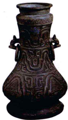
青铜壶 西周 高39.3厘米