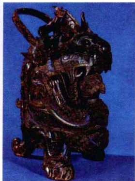
虎食人卣 殷商 高32厘米