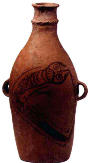
彩陶瓶鲟鱼纹 新石器时代 仰韶文化庙底沟类 高38厘米 口径6.8厘米