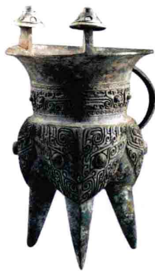
青铜器上的兽面纹 商

礼器、食器图案多有劝诫之意，饕餮贪渎、虺虫争食相残类的图像在食器上长久沿用就是一个例子。西周之后，青铜器在器型、题材上还有复杂的等级系统。对于历史学家而言，对青铜礼器的纹饰、器型研究是一个重要的问题。郭沫若先生《彝器形象学试探》（1934年，附于《两周金文辞大系图录考释》）曾作过讨论。