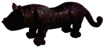
一对青铜老虎之一 西周