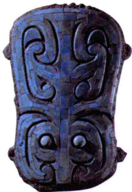
嵌绿松石饕餮纹铜牌饰 夏 长14.2厘米 宽9.8厘米 社科 院考古所洛阳工作队藏