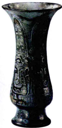
父庚卣 西周早期 上海博物馆藏

青铜器的器型是从史前陶器流演而来。民国时期，顾颉刚先生在地质调查所参观古陶器时就作过这个结论。对于青铜器的纹饰、器型，宋人多有研究，他们所定的很多名称到今天还在沿用。