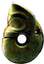
玉兽形玦 龙山文化 辽宁省建平县采集 辽宁省博物馆藏

皇、地皇之出于‘太一’与天地阴阳之哲理，黄帝出于‘皇帝’之音变，本为上帝之通名，此皆纯出虚构。至若帝俊、帝喾、太皞、帝舜之为殷人东夷之上帝及祖先神话，少皞、羿契之为殷人东夷之后土及祖先神话，益、句芒之为东夷之鸟神及祖先神话，鲧、共工、玄冥之为殷人东夷之河伯神话，朱明、昭明、祝融、丹朱、驩兜之为殷人东夷之火正神话，王亥之为殷人东夷之畜牧神神话；又若颛顼、尧之为周人西戎之上帝及祖先神话，禹、句龙之为西戎之后土及祖先神话；则皆由于原始神话分化演变而成者，固不免有原始社会之史影存乎其间。然此类亦仅为殷周东西两氏族原始社会之史影而已，乌有所谓三皇、五帝、唐、虞、夏等朝代之古史系统哉？” ①