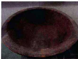
彩陶人面鱼纹盆 半坡类型 半坡遗址博物馆藏

历史学家杨宽先生就留意过这类问题，他谈到了神话传说中的所谓“史影”或历史背景，并说：“吾人证夏以上古史传说之出于神话，非谓古帝王尽为神而非人也。盖古史传说固多出于神话，而神话之来源有纯出幻想者，亦有真实历史为之背景者。吾国古史传说，如盘古之出于犬戎传说之讹变，泰皇、天