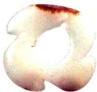
三牙玉璧 龙山文化 天津市文化局文物处藏 径4.3厘米

牙璧是石器时代一种常见的器物，晚清金石学家吴大澂在《古玉图考》中将其定名为“璇玑”，认为是古人测天的仪器配件。考古学家夏鼐先生推翻了这个说法。由于年代久远，文献无证，因此关于牙璧的功能、用途一直有多种说法。在以玉为兵器的上古时代，牙璧可能是用来抛掷的武器，有的三牙，有的四牙，形体也较大。除此之外，有些三牙璧形体较小，可能是日常装饰挂件。牙璧还常用作殉葬品，摆在死者的胸前，也许象征着生命的流转往复。有的三牙璧上还饰有蝉纹。牙璧的分布范围很广，在中国的北方、西部和南方的史前文化遗址中都有发现。周代礼制文化兴起后，玉器形制日趋规范，三牙、四牙玉璧逐渐少见。