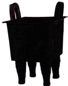
青铜礼器鼎 商中期 1974年河南郑州出土