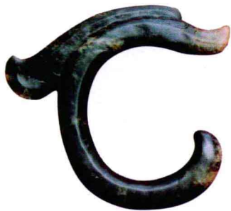
玉龙 红山文化 高26厘米 内蒙古翁牛 特旗博物馆藏

1959年，古史学家徐旭生在豫西进行对夏墟的调查时，在偃师市翟镇乡二里头村发现了一处大型遗址。此后，新中国三代考古学者对这一遗址进行了40多次发掘。考古发掘和研究情况表明，这里是公元前19世纪至公元前16纪中