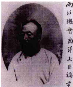
两江总督南洋大臣端方

端方（1861—1911），中国清末金石学家。字午桥，号陶斋。西周青铜校禁在历代青铜器中属上乘佳品。校禁，包括附列其上的卣、觚、爵、角、尊等12件青铜酒器，最早就是由他收购（现藏美国纽约大都会艺术博物馆）。光绪三十四年（1908），端方《陶斋吉金录》八卷问世，书中收录了自商周至六朝隋唐时期的青铜礼器、兵器、权量、造像等359件，其中包括青铜校禁、克鼎、攸从鼎、颂、谏、师卣等。