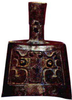
铙 铙又称为钲和执钟，是我国最早使用的青铜打击乐器之一，其最初的功能为军中传播号令之用。流行于商代晚期，周初沿用。