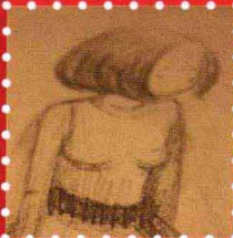
Namu拿木 · 兰州