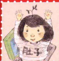
肚子 · 北京