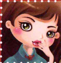
Sunflower · 武汉