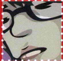
Zasu · 上海