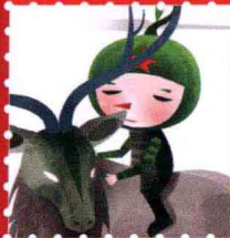
蓝风花 · 北京