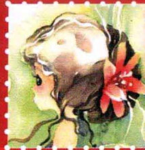
小花与美丽 · 武汉