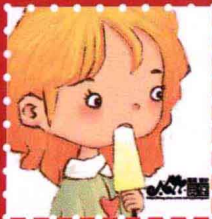
妮莹莹 · 广州