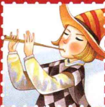
贝贝熊 · 武汉