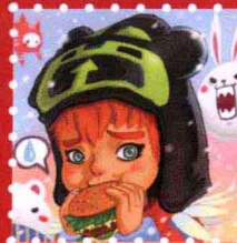
Jimmi · 江门