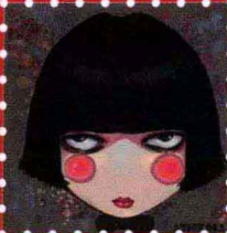
Butu布兔 · 北京