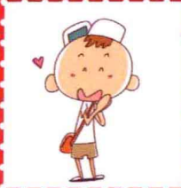
灯泡同学 · 上海