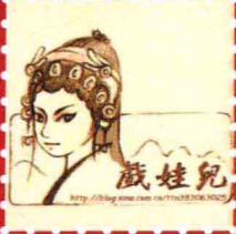
戏娃儿 · 宁波