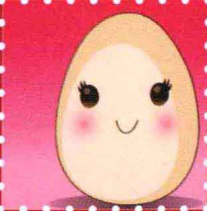
蛋蛋 · 武汉