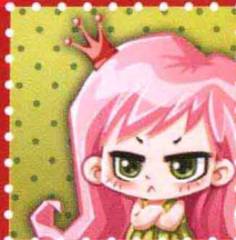
阿布 · 宜昌