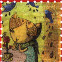
黛西 · 上海