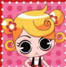
麦田 · 上海