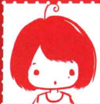
甘俊 · 上海