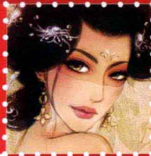
花开天堂 · 深圳