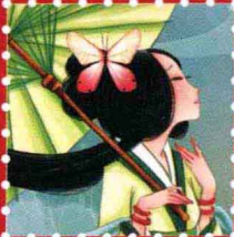
蓝 · 青岛