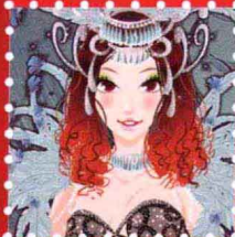
Fannie · 上海