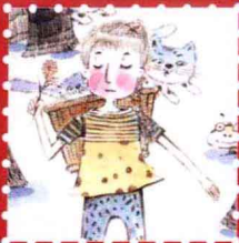
灵猫 · 武汉