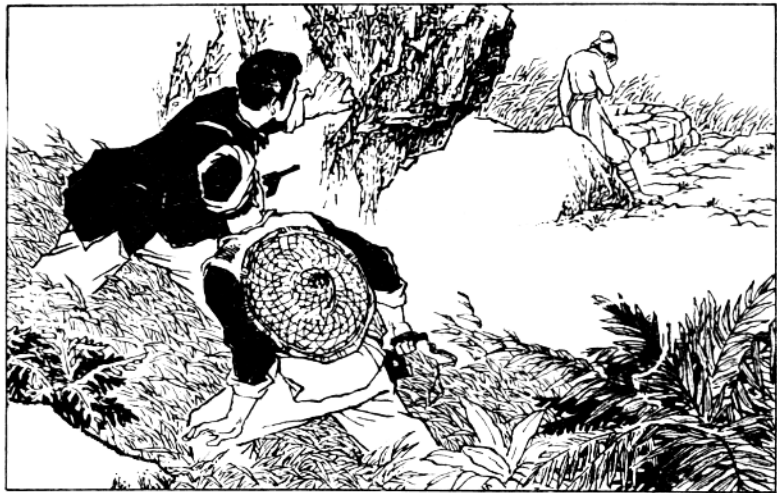
( 5 ) 绕过山角，看见一个瑶族姑娘站在水井边上哭泣。