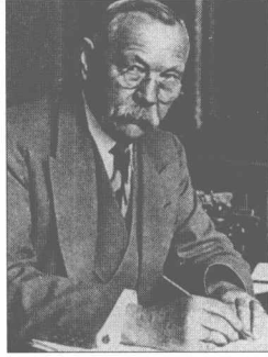
阿瑟·柯南·道尔爵士 Sir Arthur Conan Doyle (1859–1930)