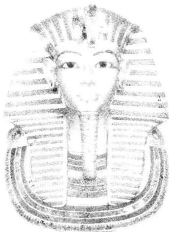
这是一幅新近发现的古埃及法老面具，可见其刚毅之气