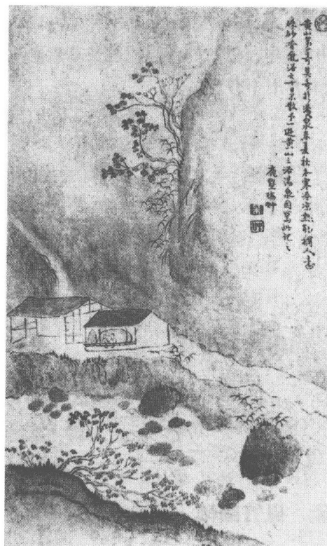
清 梅翀 黃山圖(之三)