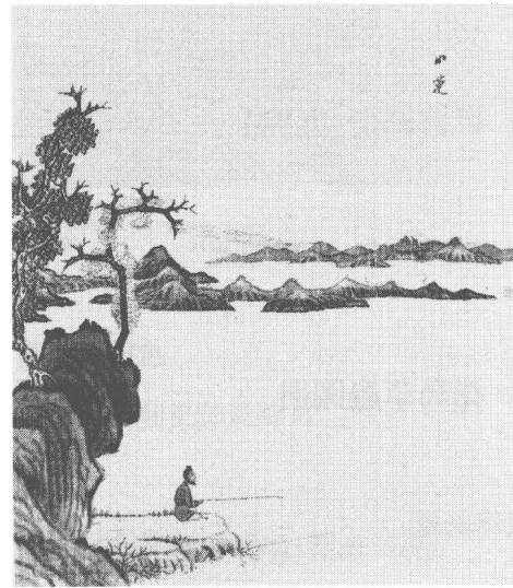
清 陳宇 雜畫(之四)