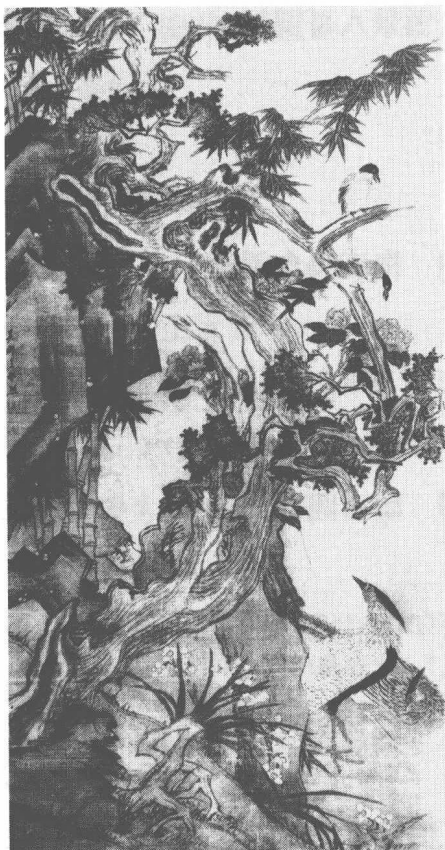
明 王維烈 白鷗圖