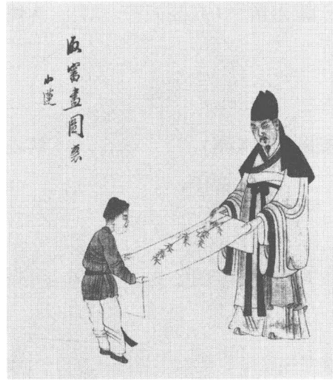
清 陳宇 雜畫(之三)