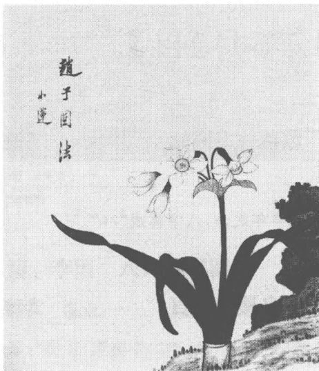
清 陳宇 雜畫(之二)