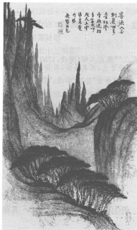
清 梅翀 黃山圖(之四)