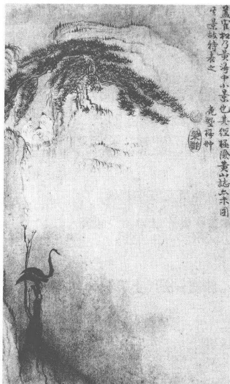
清 梅翀 黃山圖(之二)