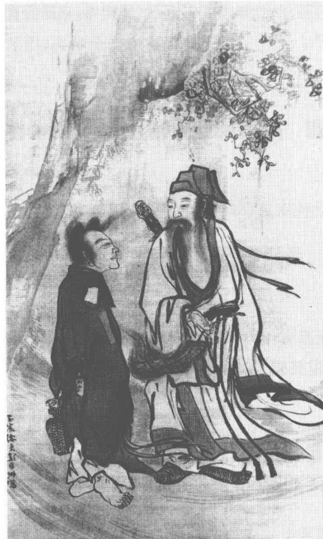
明 彭舜卿 二仙圖