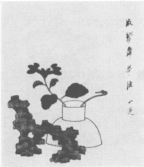
清 陳宇 雜畫(之一)