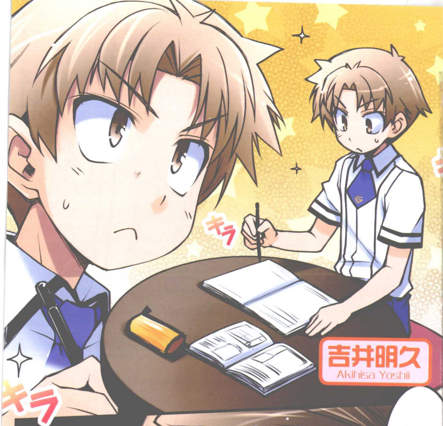
吉井明久 Akihisa Yoshi