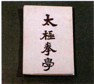
孙禄堂著《太极拳学》