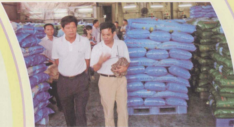
湛江“科技兴市”调研组深入“粤海饲料”考察。