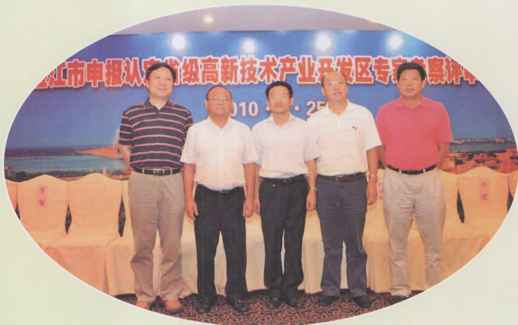
图为湛江市委书记陈耀光（左二）、广东省科学技术厅副厅长龚国平（左三）、湛江市副市长梁志鹏（右二）、广东省科学技术厅高新处处长卢进（左一）、湛江市科学技术局局长陈宜（右一）。