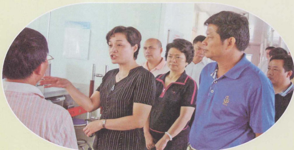
广东省知识产权局局长陶凯元（左二）到湛江考察。