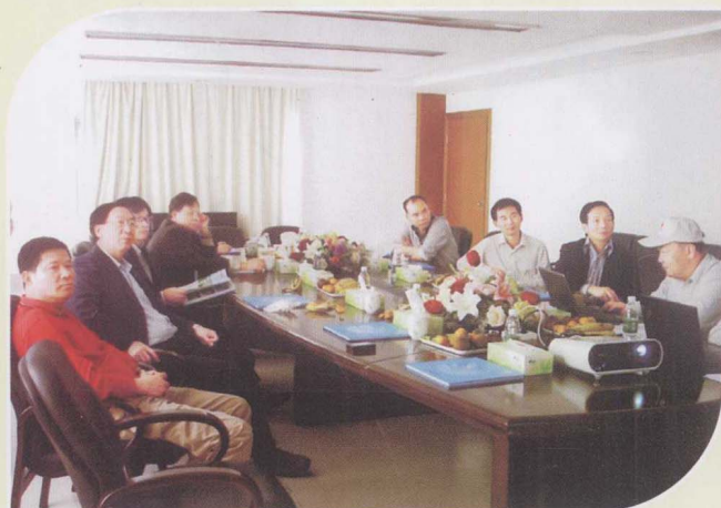
科学技术部农村科技司司长陈传宏（左排前二） 在湛江恒兴集团座谈。