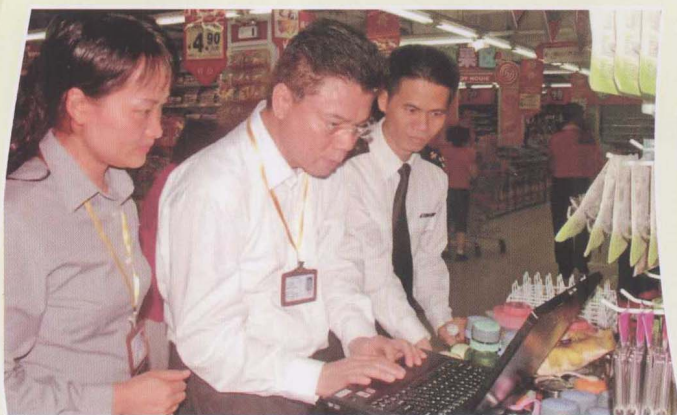
湛江市知识产权执法人员在认真细致地检查商品的标式、标记是否有违法行为，保护知识产权权利人合法权益。