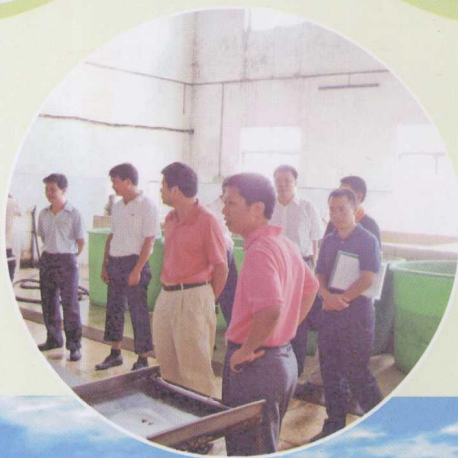
◀ 湛江“科技兴市” 调研组考察湛江市新科 食品有限公司农产品加 工车间。