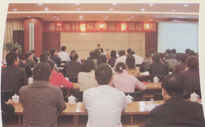
湛江市科技项目申报、管理培训班学员在上课