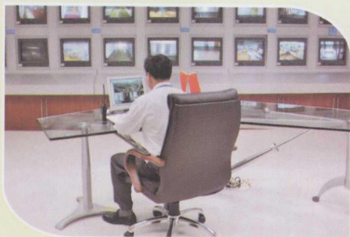
国联水产“2211”电子监管系统。