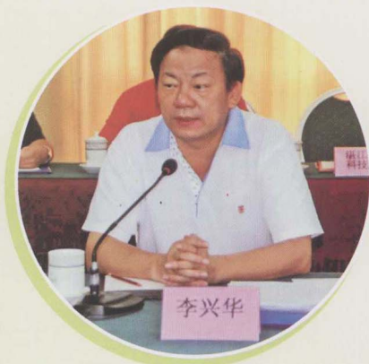
广东省科学技术厅厅长李兴华 在湛江主持调研座谈会。