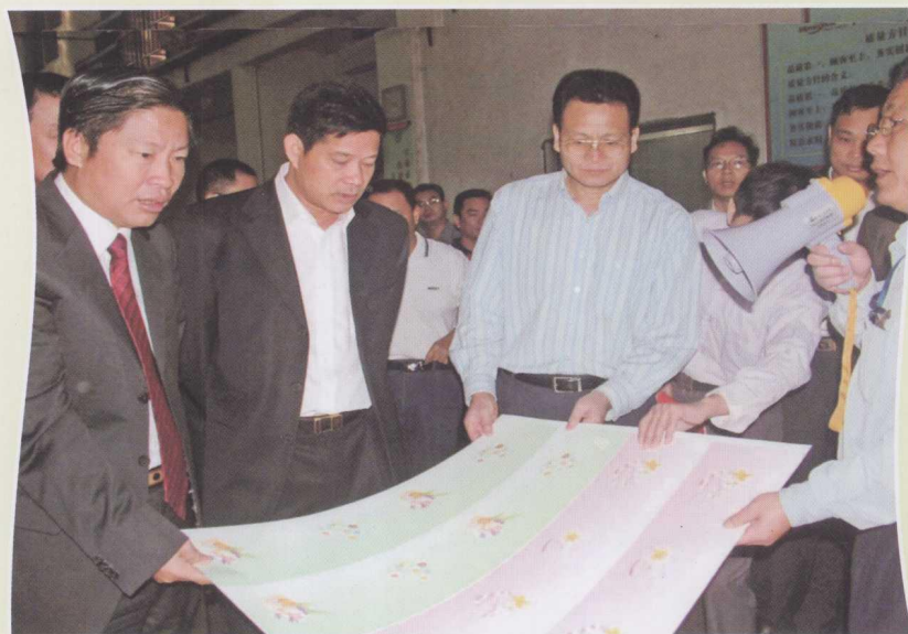
2009年11月15日，廉江市委书记许顺（左一）、市长何鑫（左三）与湛江市科学技术局局长陈宜（左二）带领的“科技兴市”调研组在廉江市电饭煲生产基地调研。