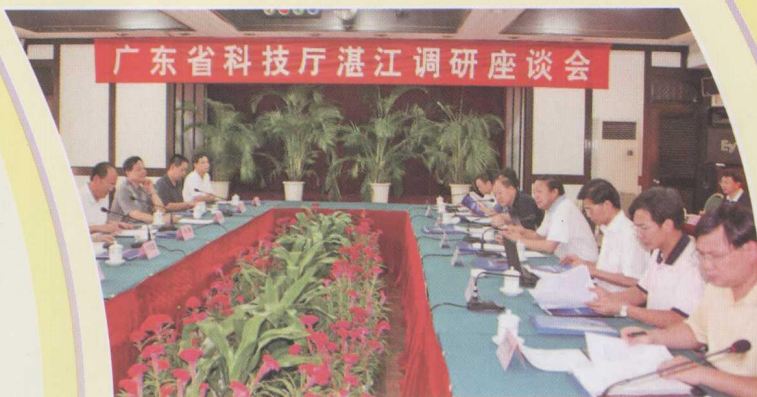
广东省科学技术厅李兴华厅长到湛江调研。