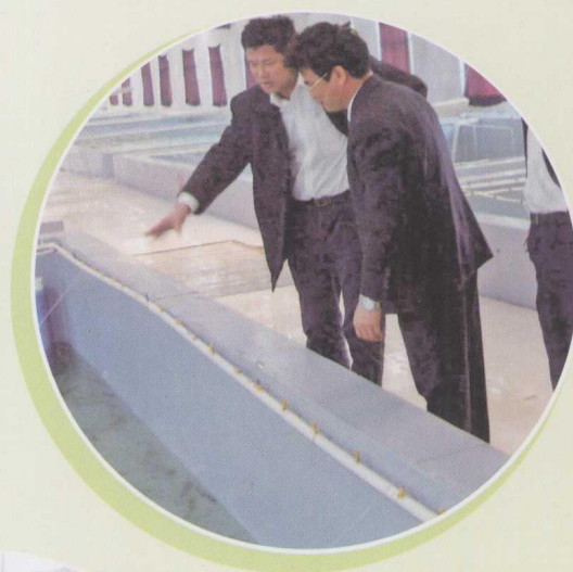
▲ 湛江“科技兴市” 调研组在恒兴水产基地 考察。