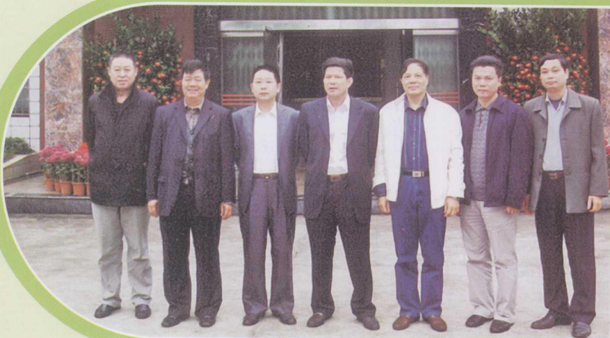
湛江市科学技术局领导班子全体成员。