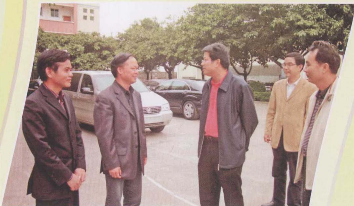
中国工程院院士麦康森（左二）考察湛江市科技企业。