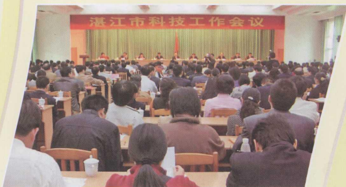
湛江市召开科技工作会议，要求全市上下齐心协力推动科技创新、支撑和引领湛江经济又好又快发展。