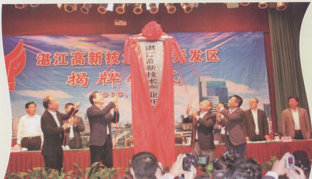
2010年11月8日，湛江高新技术产业开发区举行揭牌仪式。湛江市委书记陈耀光（右二）、市长阮日生（左二）等为“湛江高新技术产业开发区”揭牌。