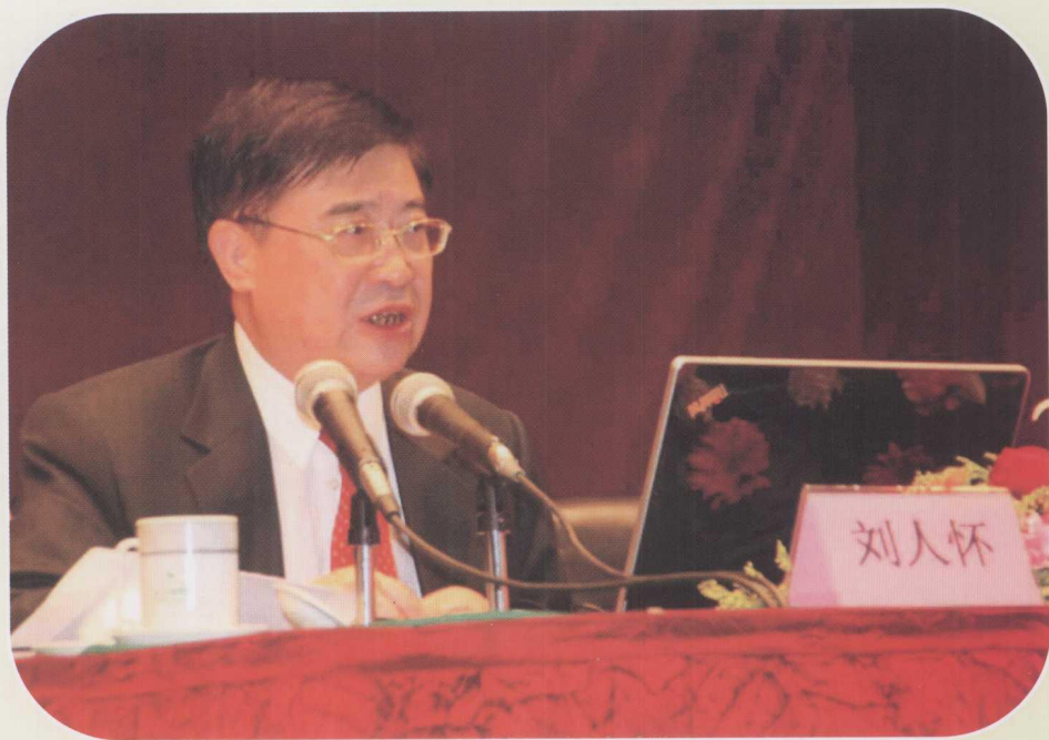
2010年11月8日，刘人怀院士应邀到我市作“关注世界科技创新动态，大力推动产学研合作”的科技报告。