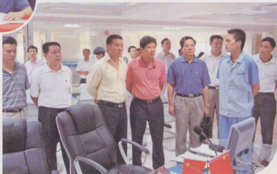
湛江市科学技术局领导到“国联水产”考察。▶