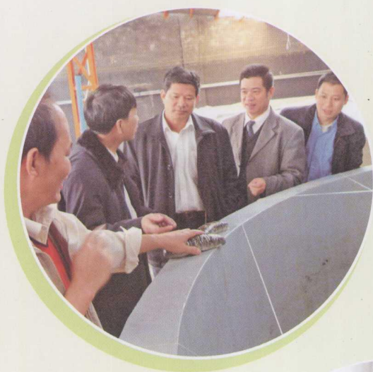
▲ 湛江“科技兴市” 调研组在 海参养殖基地 考察。