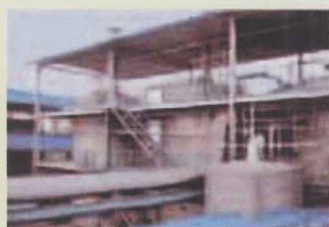
五洲药业集团车间一览。