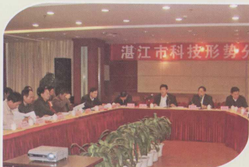
在湛江市科技形势分析会上，有关领导号召全市科技工作者树立“信心比黄金更重要”的观念。