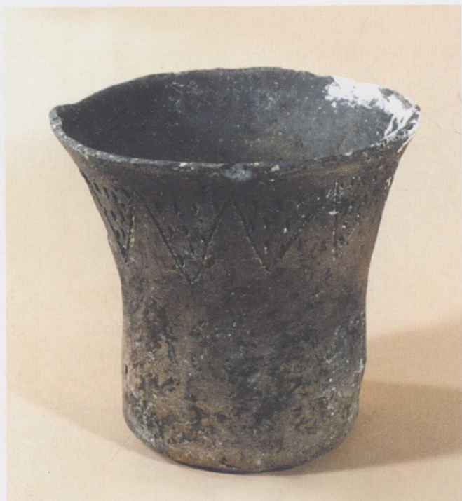
7 黑陶杯 和硕县新塔拉遗址出土,距今 3500—3000 年。