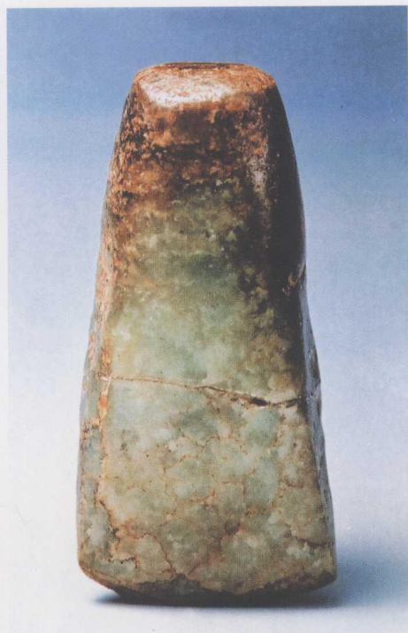
8 玉斧 地点同图 7,距今 3500 年。