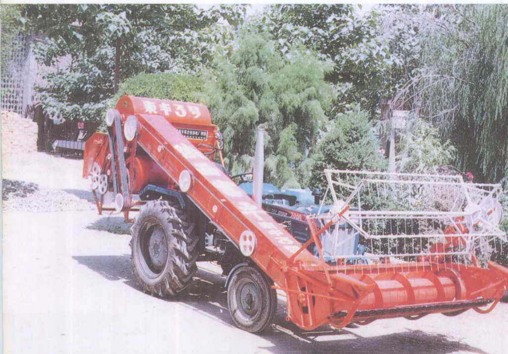
富平联合收割机厂