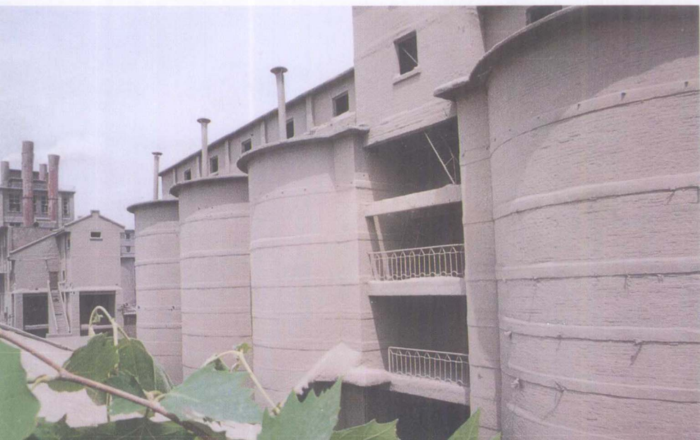
县水泥厂生产区一角