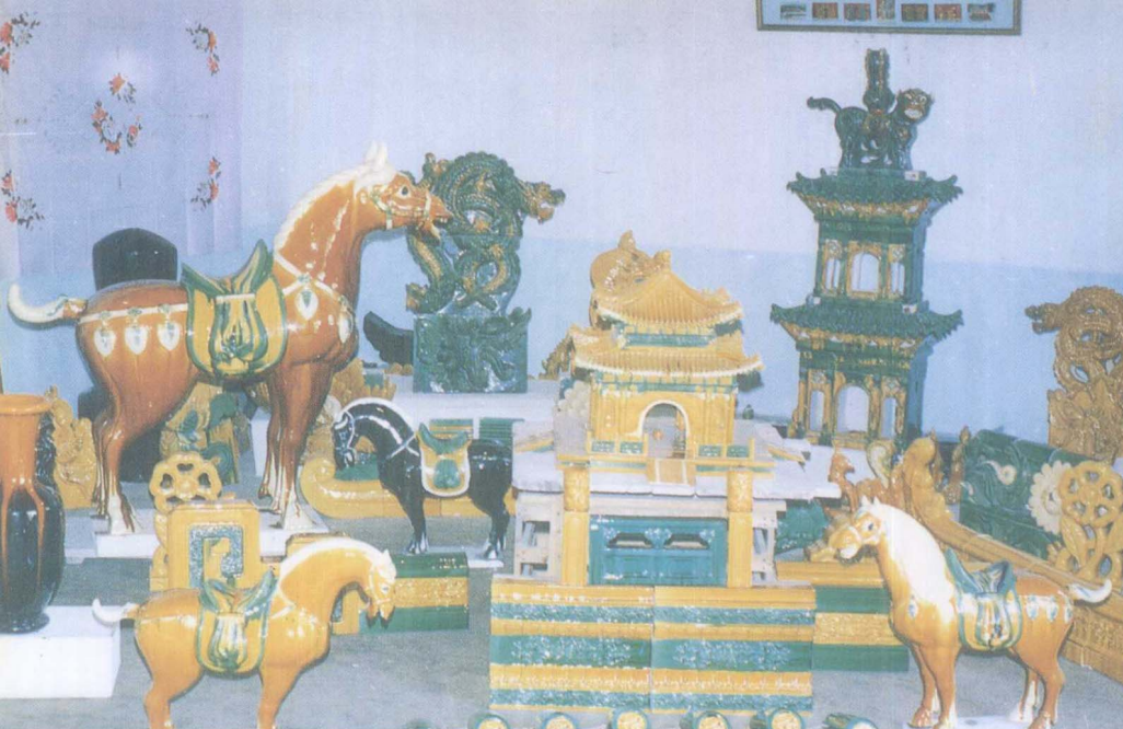
陕西省乔山建材琉璃工艺有限公司的主要产品