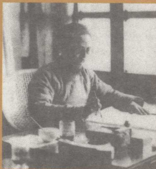
在故乡缘缘堂前楼作画（1937年）