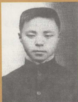
丰子恺在浙江省立第一师范学校（1918年）

1919年他毕业于师范学校，与同学往上海合办上海专科师范学校，并任该校美术教师。两年后，子恺向亲友筹借学费，并卖去石门湾下西弄祖宅一栋，赴日本学画。在日本，他深受日本漫画家竹久梦二和谷虹儿的影响。归国后，即以漫画抒写古诗意境、儿童生活、社会现实观感，从1924年起陆续发表于报刊，深得广大读者的喜爱、赞赏。