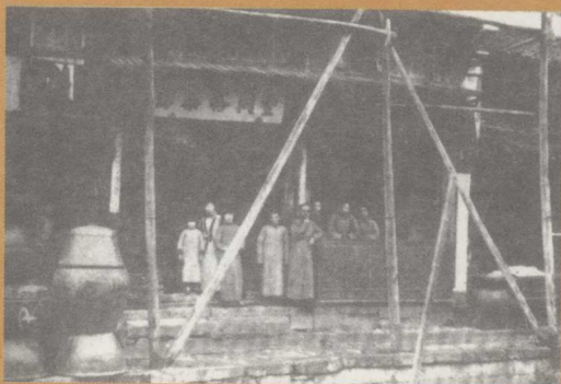
戴墨镜者为丰子恺，摄于浙江省石门镇（约1936年）