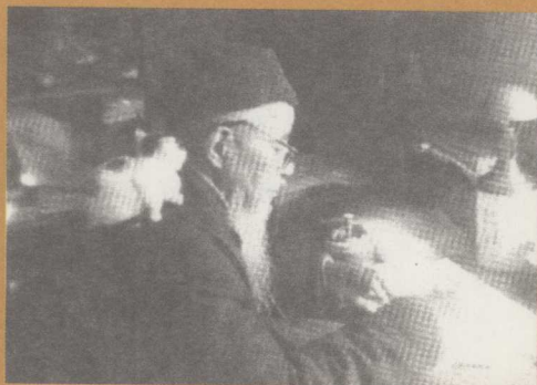
丰子恺在上海日月楼（1963年）

1949年大陆解放，丰子恺52岁了。此后他专事著译。他在68岁时，完成《护生画集》第五集。69岁时，“文化大革命”开始了，那时他住在上海，大字报，逼供信，抄家，关“牛棚”，紧缩住房，下乡劳动，写不尽的检讨交代，批斗，挂牌，游街，克扣工资，丰子恺备受种种精神上的侮辱和肉体上的摧残。但他横下一条心，把坐“牛棚”看做参禅，把批斗看作演戏。夜晚过黄浦江去游斗，他说是“浦江夜游”；在“牛棚”中被叫去训话，他好像是去上一回厕所，回到“牛棚”照旧与画师们谈笑风生，或偷偷地做诗填词。到上海南郊劳动，冷天睡在铺稻草的泥地上，屋顶隙缝中飘下来的雪积在他枕边，70多岁的老人早上还得亲自到河埠打水洗脸，但他风趣地说：“地当床，天当被，还有一河浜洗脸水，取之不尽，用之不竭，是造物者之无尽藏也。”回到家里，不管白天发生过天大的事，也只是轻描淡写地叙述一遍，有时甚至避而不谈，只要一斤黄酒入肚，仍是吟诗诵词，谈笑自若。