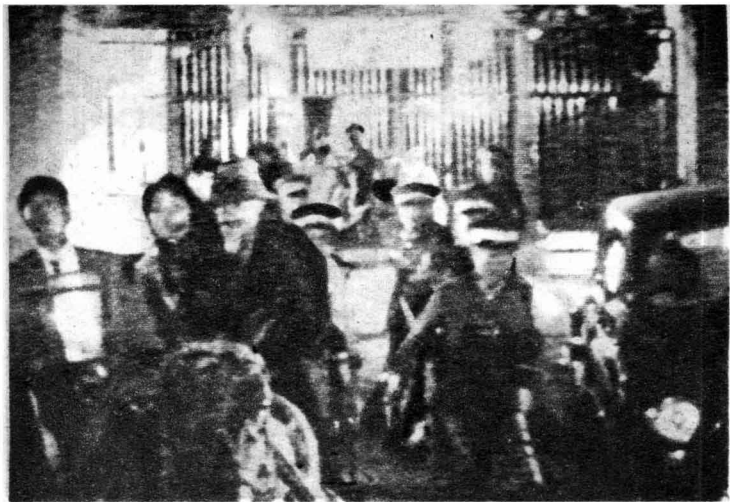
11 检票口顿时大乱，警笛急吹，人喊马嘶，一群警察特务吆喝着向“纪念碑”方向扑来。