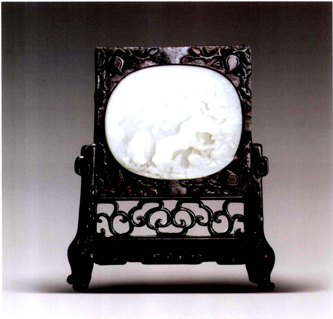
浮雕蟠桃纹玉砚屏