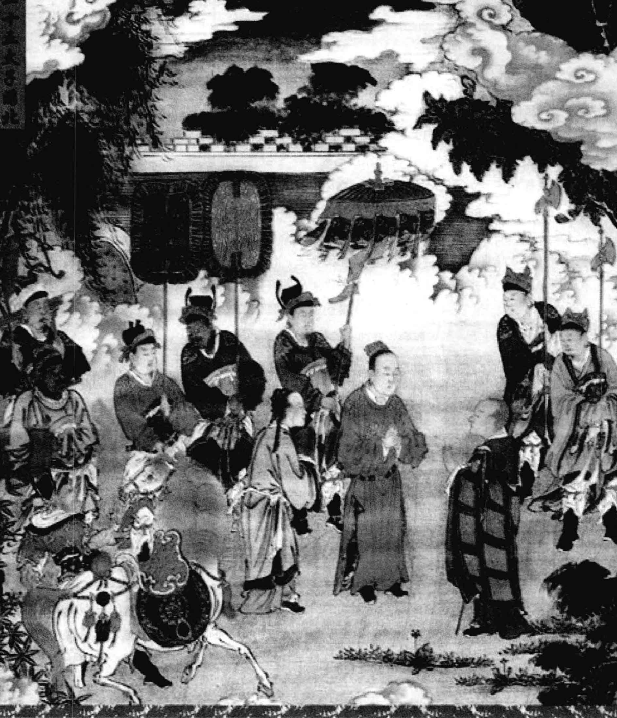
太子游北门见僧弃车问讯 明 壁画

图为释迦牟尼在出行时遇见沙门，相传释迦牟尼在北门游玩时遇见了一位出家修行的沙门，并由沙门的开示产生了出家修行的念头。梅伽斯提尼斯在其著作中指出：“沙门不住在城中，甚至也不住在屋中，穿树皮衣，吃橡子，用手捧水喝，不结婚，不生子，行苦行，枯坐终日不动。”季羨林先生认为他的描述基本属实。