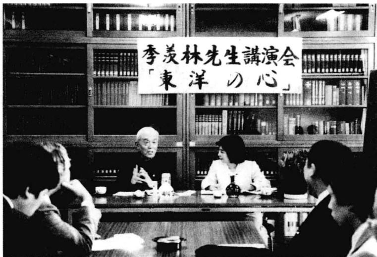
季羨林先生在日本演讲

图为1986年5月，季羨林先生在日本演讲的场面。从日本回来之后，季羨林先生深有感触，并指出：“日本人口众多，土地面积狭小，竟然留出这样多的土地供寺院使用，其中必有缘故吧。我个人认为，这是一个非常有趣、非常有意义的现象，值得我们深入研究。”