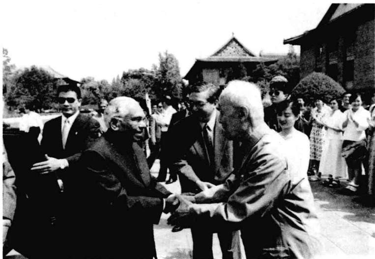
季羨林先生在北京大学迎接印度总统

图为2000年，印度总统访问北京大学，季羨林先生、许智宏校长和学校学生前往迎接。季羨林先生长年任教于北京大学，在语言学、文化学、历史学、佛教学、印度学和比较文学等方面都有很深的造诣，不仅是北京大学的大师，也被称为当代最著名的印度学家。