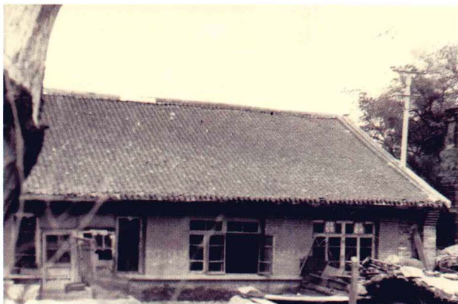
修缮前的萧红故居