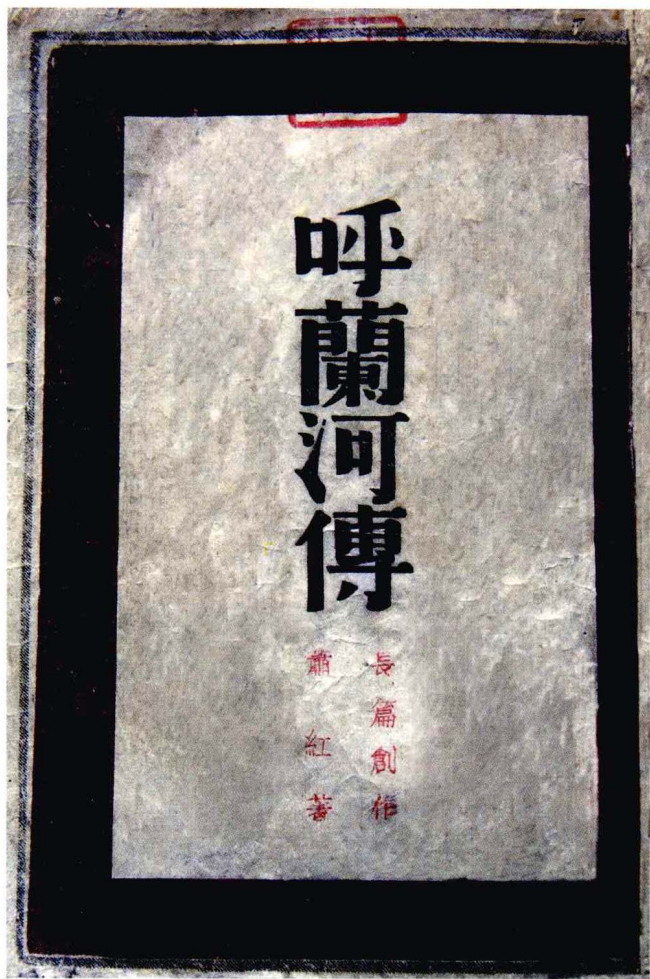
《呼兰河传》初版(1940年)封面