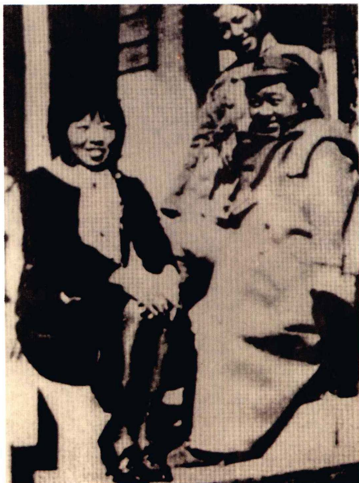
在西安与丁玲合影 (1938年)