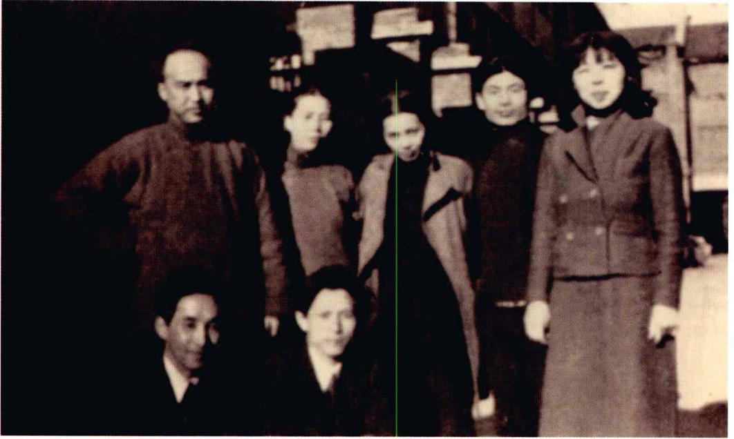
在上海与胡风、萧军等人合影 (1937年)