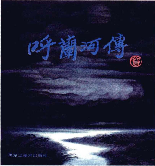
《呼兰河传》连环画（侯国良作）