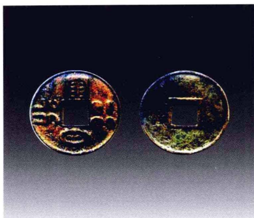
未破译契丹文母钱