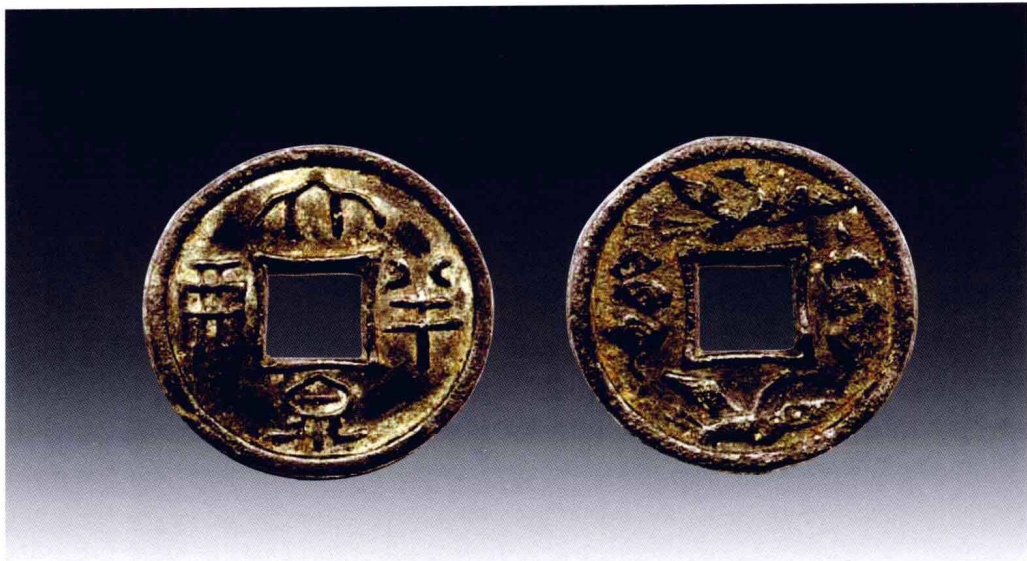
契丹文“大泉半两”背天鹅飞禽铜钱

音。这个特点即应是判别“胡书”和契丹大字区别的要点之一。变形、改变部首、偏旁、增减笔画应是早期创制的主要方法，而象形、指事、会意、形声、转注、假借的造字法在唐中后期胡书中才有较多的运用，这是判别胡书和契丹大字区别的要点之一。