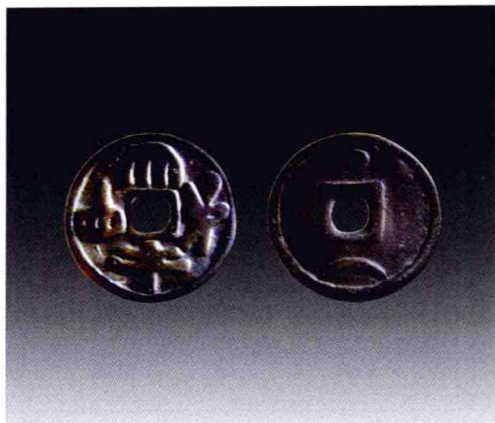
契丹大字背星月铜钱

从各种契丹文胡书钱可以看出胡书创制、发展、演变，以及至整理、改造、归纳成为契丹大小字的轨迹，以及契丹人创造胡书文字的方法及其在契丹大小