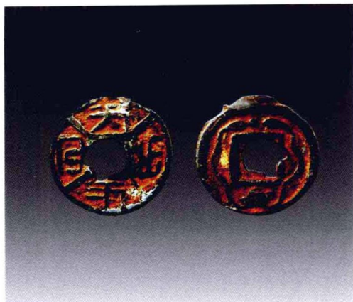
异文疑似契丹文背龙凤铅钱