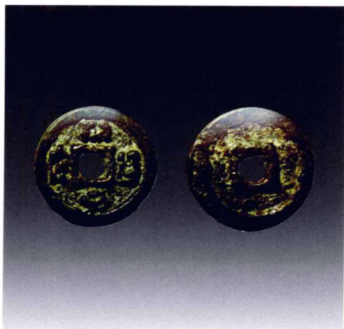
契丹文“开元通宝”铜钱