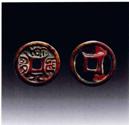
面背四决契丹小字钱铜钱

还有人说这些胡书钱可不可能是契丹以外民族铸造的？现在还不能绝对否定。但从钱币风格、钱文和契丹大小字的关系，这些“胡书”钱与同时期中原王朝及契丹的历史关系，以及其出土的地域与契