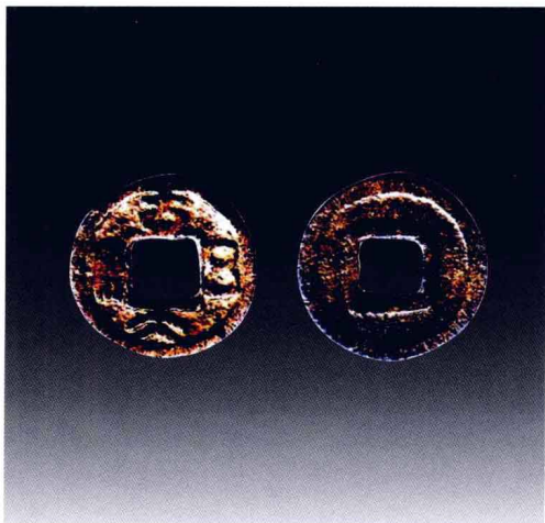
契丹文“吉大五铢”铜钱