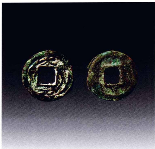
契丹文“太元货泉”铜钱