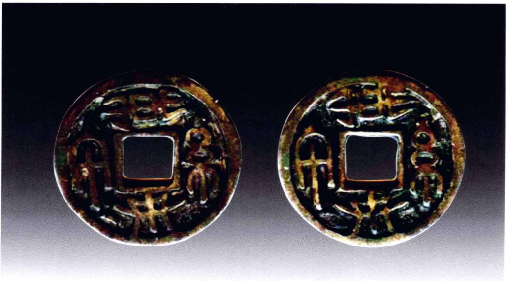
篆书体契丹文合背铜钱

由此断定，“小泉直一”、“常平两铢”、“开元通宝”之类的胡书钱，是耶律阿保机907年建立契丹国以前铸造，