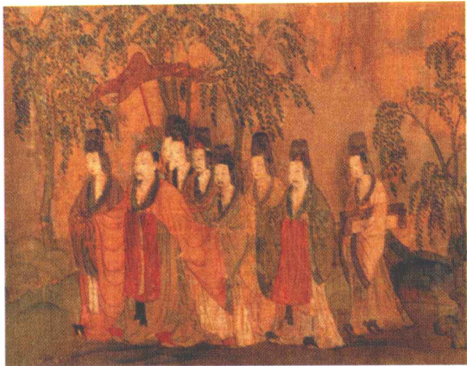
顾恺之洛神赋图卷（局部）