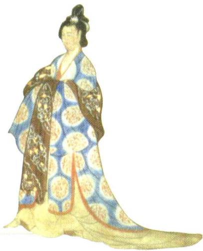
绢画引路菩萨图中的贵妇 唐代 敦煌莫高窟藏经洞发现

为了配合解读效果，书中选录了大量插图，可分为两大类，一类是印证作者画题，另一类是补充画史的背景，以求对发生在中国的绘画进程呈现出真实而简略的概貌。以图证史，成为此书的又一特色。