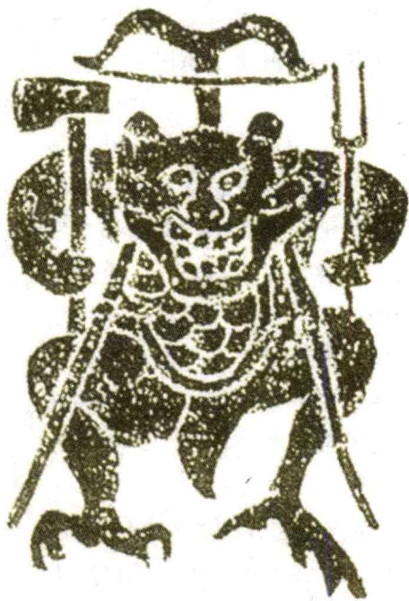
蚩 汉画像石中的蚩尤形象

垢，接着又梦见一个人手执千钧之弩驱赶着万只羊群。醒来后，他不禁心觉奇怪，暗想：风，号令而为主；垢，去土后在边。天下难道有姓风名后的人吗？千钧之弩，是希望能致远；驱万只羊群，是牧人为善。难道有姓力名牧的人不成？于是便派部下在天下到处访寻这两个人。结果在海隅找到了风后，在泽边找到了力牧。黄帝以风后为相、力牧为将，开始大举进攻蚩尤。