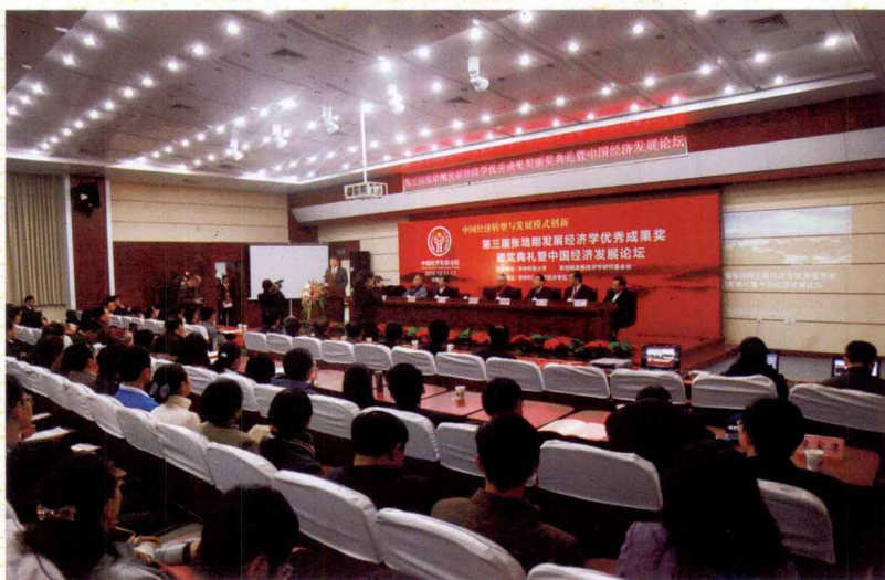
第三届张培刚奖颁奖典礼会场