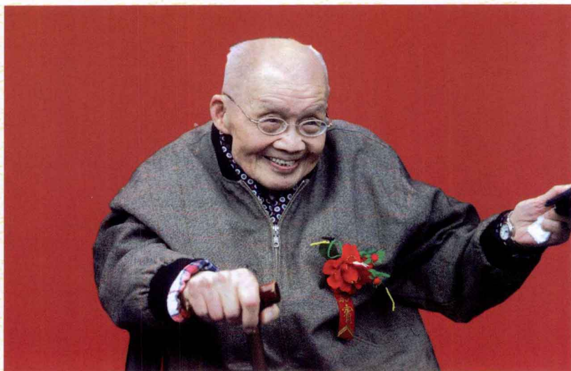
张培刚教授出席颁奖典礼