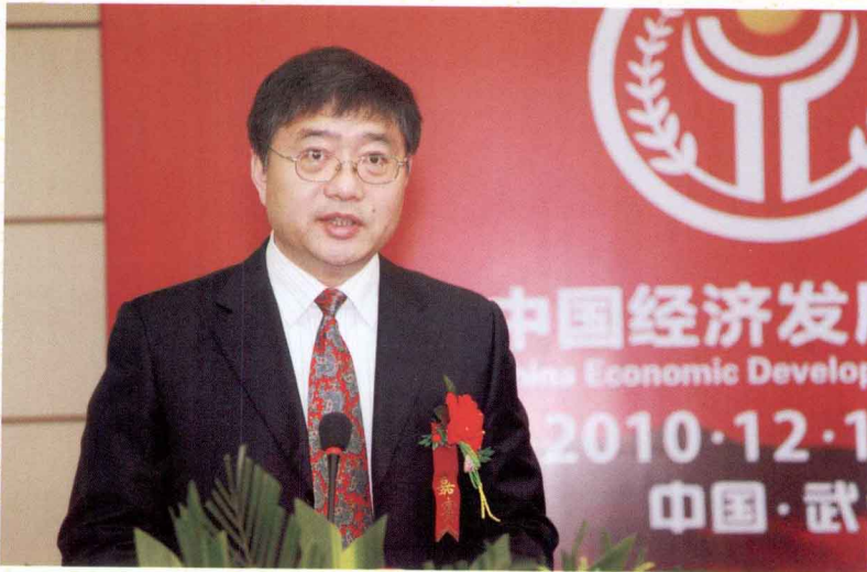
华中科技大学校党委书记路钢在第三届张培刚奖颁奖典礼上致辞