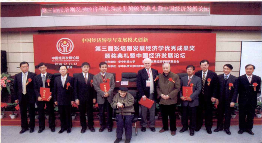
中国侨联联络部副部长安晨（右三），中共湖北省委宣传部副部长余立国（右一），湖北省侨联主席谢余卡（左三），湖北省社会科学联合会副主席刘宏兰（右二），华中科技大学党委书记路钢（左四），华中科技大学副校长杨勇（左一）等领导出席第三届张培刚奖颁奖典礼