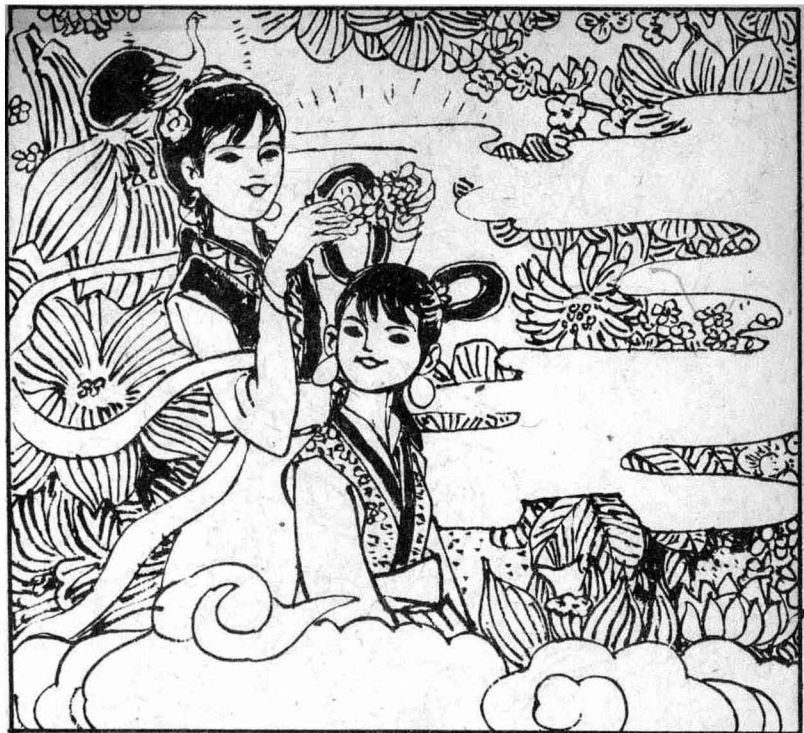
5 花姑娘编了一顶鲜艳的花环，戴在小仙女的头上，格外漂亮。