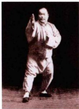
杨澄甫示范提手上势