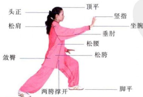
图 1-2-1 身体各部位姿势要领——搂膝拗步

(4) 臂如刀锯：手臂在回引时，状如挂钩（回手如钩），要求手臂放松、悬挂，呈现出钓竿状的弧形。前推时，状如锉刀（出手如锉），要求手臂基本伸直，坐腕、竖指，使手臂保持一定弧度，似直而非直。运化的手臂（如接手）在运至