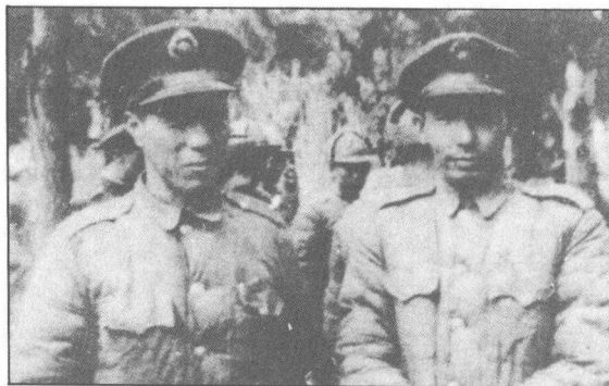
第三綏區副司令張克俠（右）、何基澧 率兩萬餘人向共軍投誠。