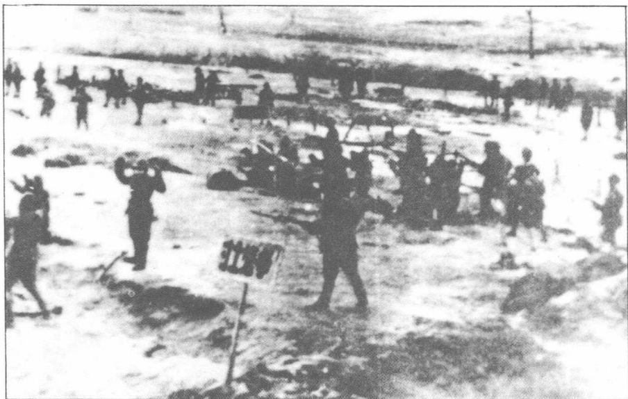
增援錦州的國民黨軍隊被共軍阻於塔山地區。