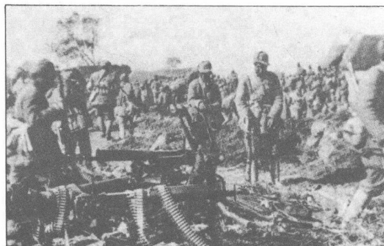
在陳官莊向共軍繳械的國民黨部隊