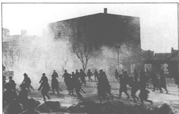
共軍攻進錦州城內。