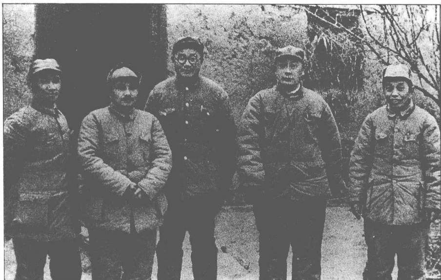
淮海戰役的共軍指揮將領，左起：粟裕、鄧小平、劉伯承、陳毅、譚震林。