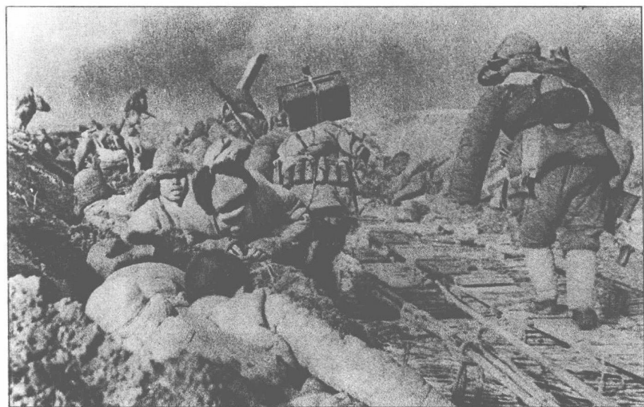
共軍向天津國民黨守軍發動攻擊。