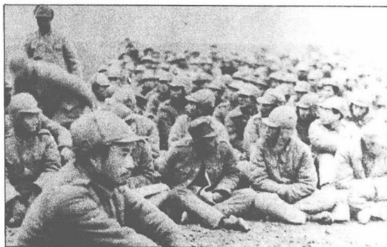
被俘的第十二兵團司令黃維（前左）及其部下。