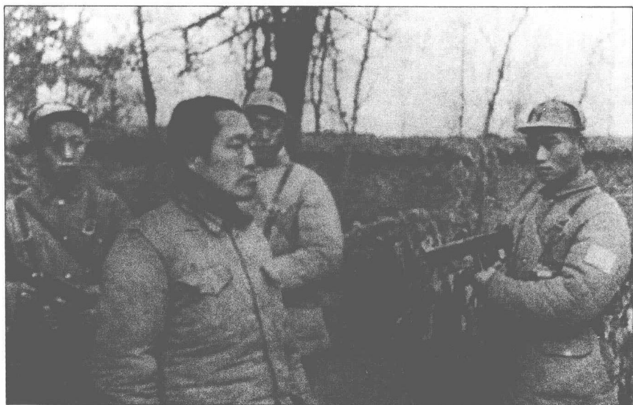
徐州剿總副總司令杜聿明被共軍俘虜。