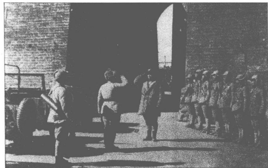
共軍在北平朝陽門前接受國民黨部隊交防。