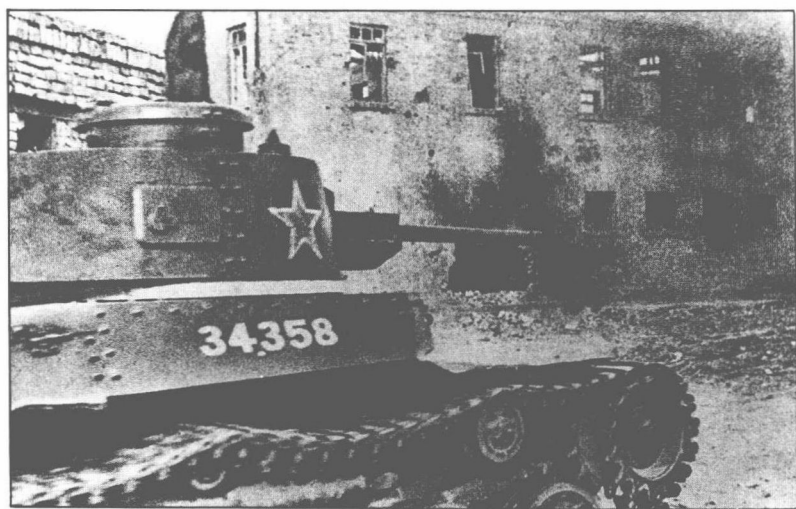
1948年9月，共軍發動遼瀋戰役，向錦州進攻。