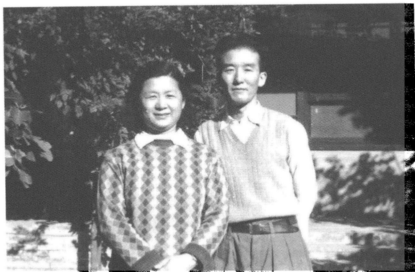
㉑ 1958年，丁一岚与邓拓在遂安伯胡同家中。