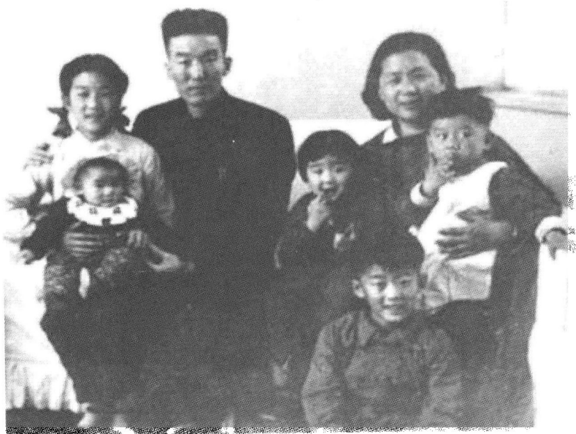
⑳ 1955年，邓拓、丁一岚与膝前五个孩子的全家照。