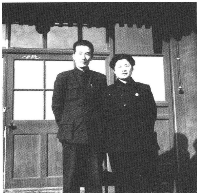
⑯ 1951年，丁一岚与邓拓在煤渣胡同人民日报报社宿舍。