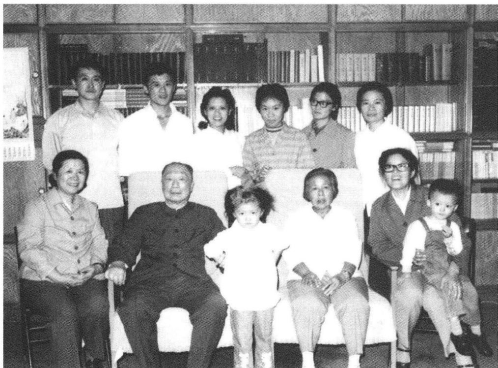
④ 1979年9月邓拓平反追悼会前，聂荣臻元帅请丁一岚家三代人到家中作客。