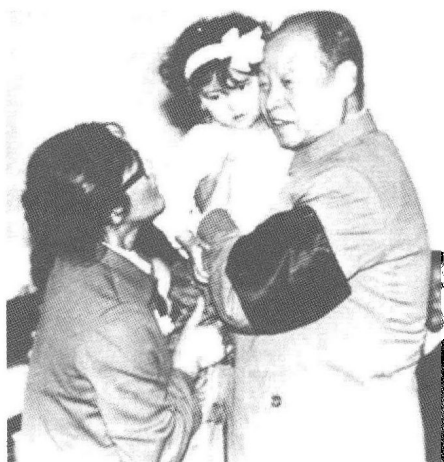
③③ 彭真同志在邓拓平反追悼会上，抱着老战友的外孙女，以示对逝者的怀念。