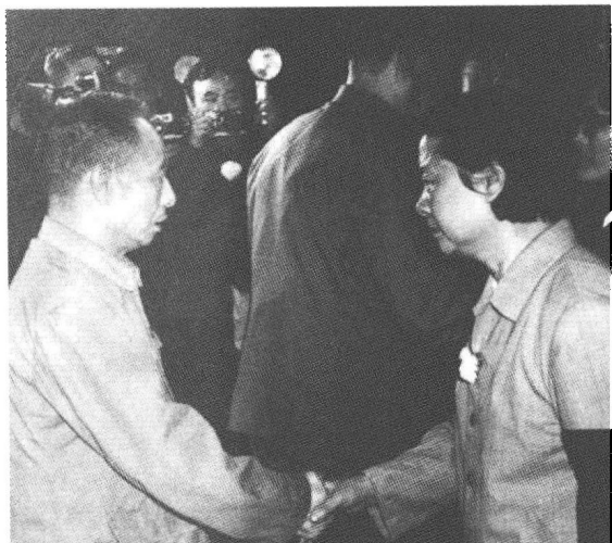
③② 1979年9月，时任中央组织部部长的胡耀邦同志主持了邓拓追悼会，并慰问家属。