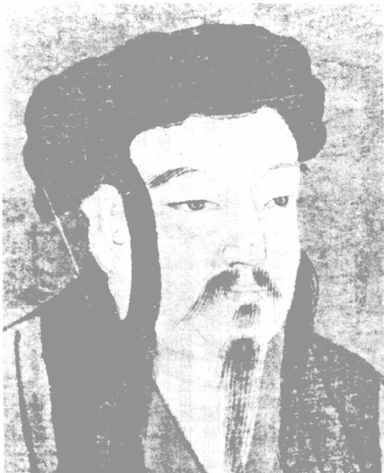
國立故宮博物院藏品