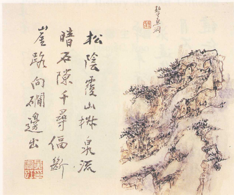
彩圖15 黃賓虹〈黃山臥游冊〉之一 1949