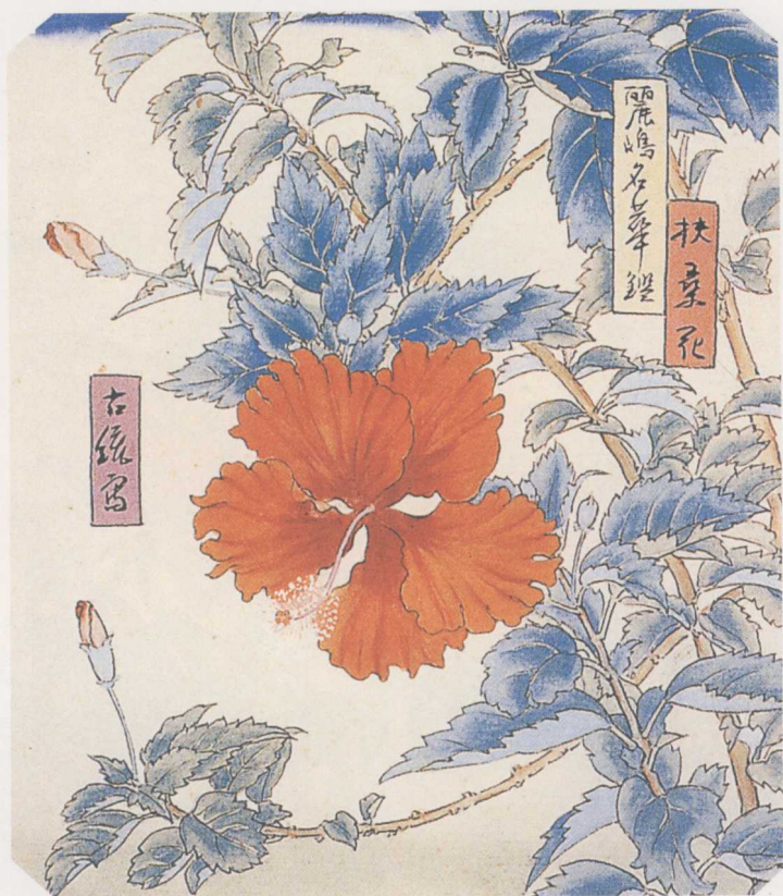
彩圖11 鄉原古統〈麗島名華鑑〉 1927~36