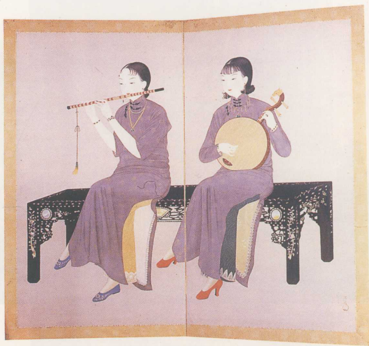
彩圖8 陳進〈合奏〉 1934