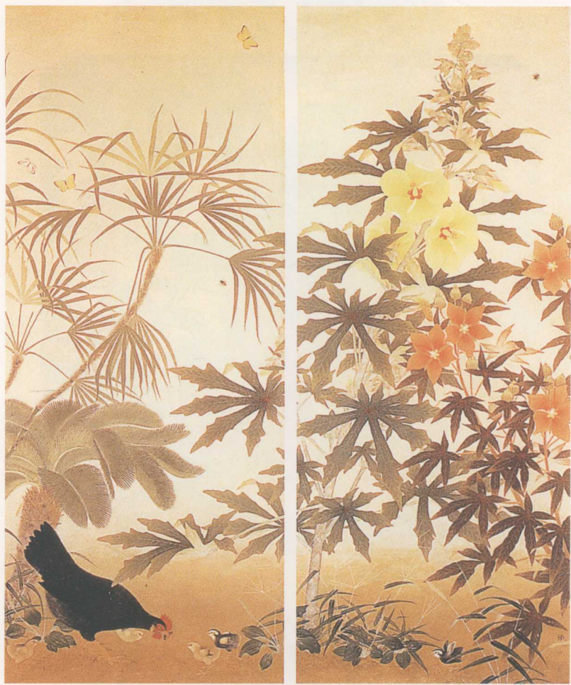
彩圖12 呂鐵洲〈後庭〉 1931