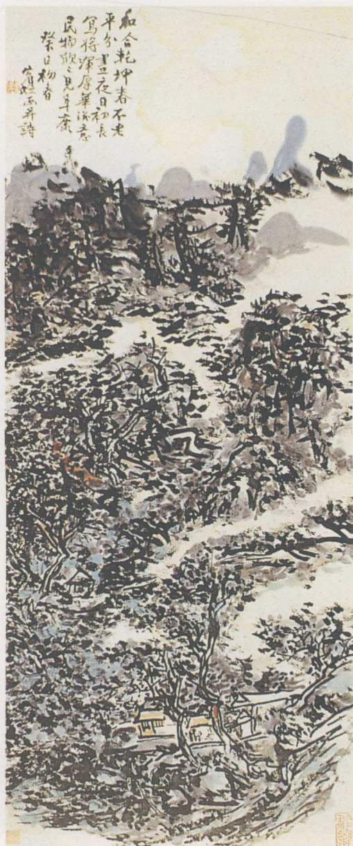
彩圖3 黃賓虹〈寫意山水圖軸〉 浙江省美術館藏