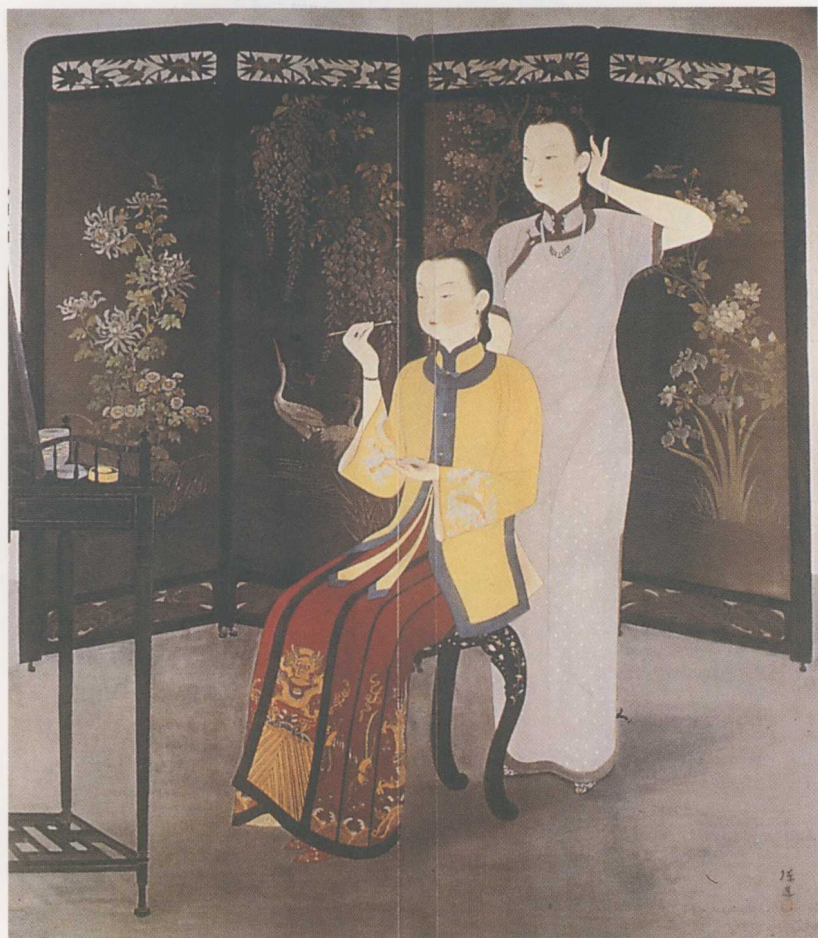
彩圖9 陳進〈化妝〉 1936