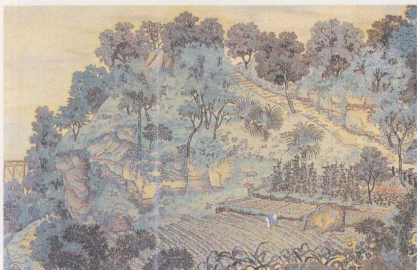
彩圖7 郭雪湖〈圓山附近〉 1928