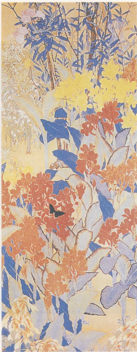
彩圖10 木下靜涯〈南國初夏〉 1920~30