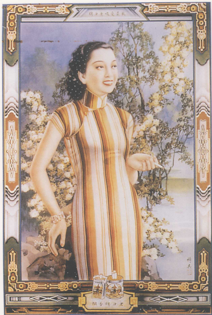
彩圖4 倪耕野作月份牌