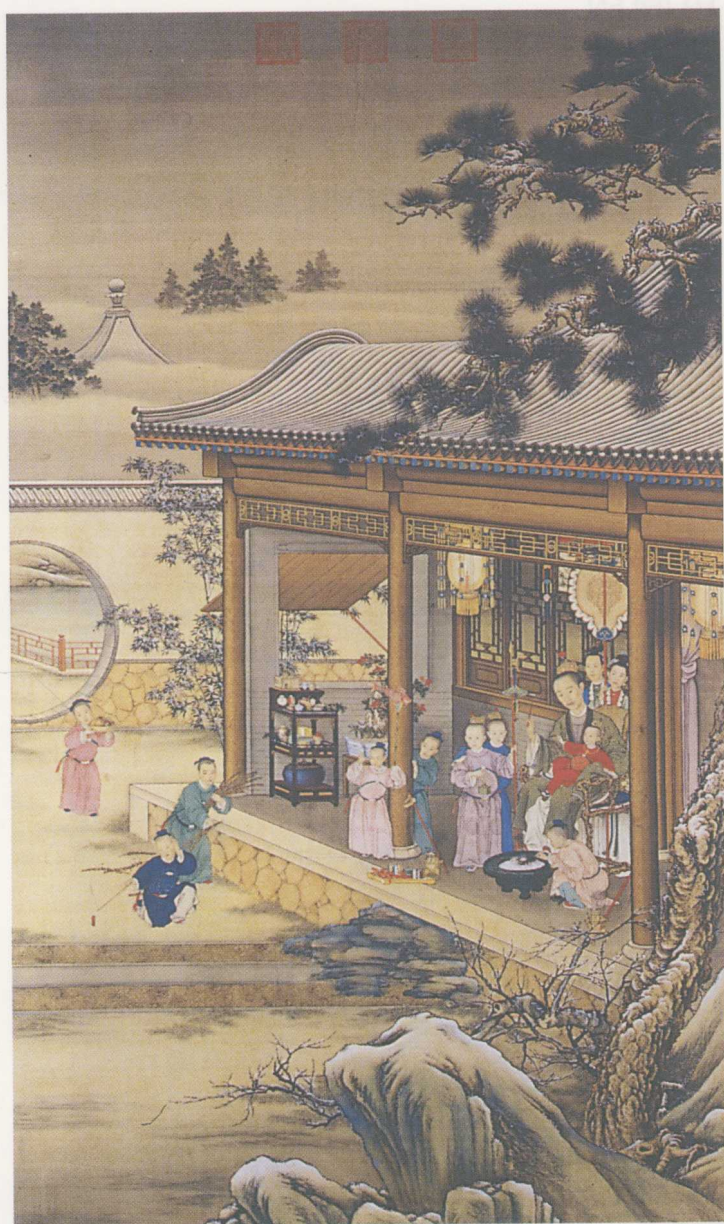
彩圖2 郎世寧等〈乾隆皇帝歲朝行皇圖軸〉北京故宮藏