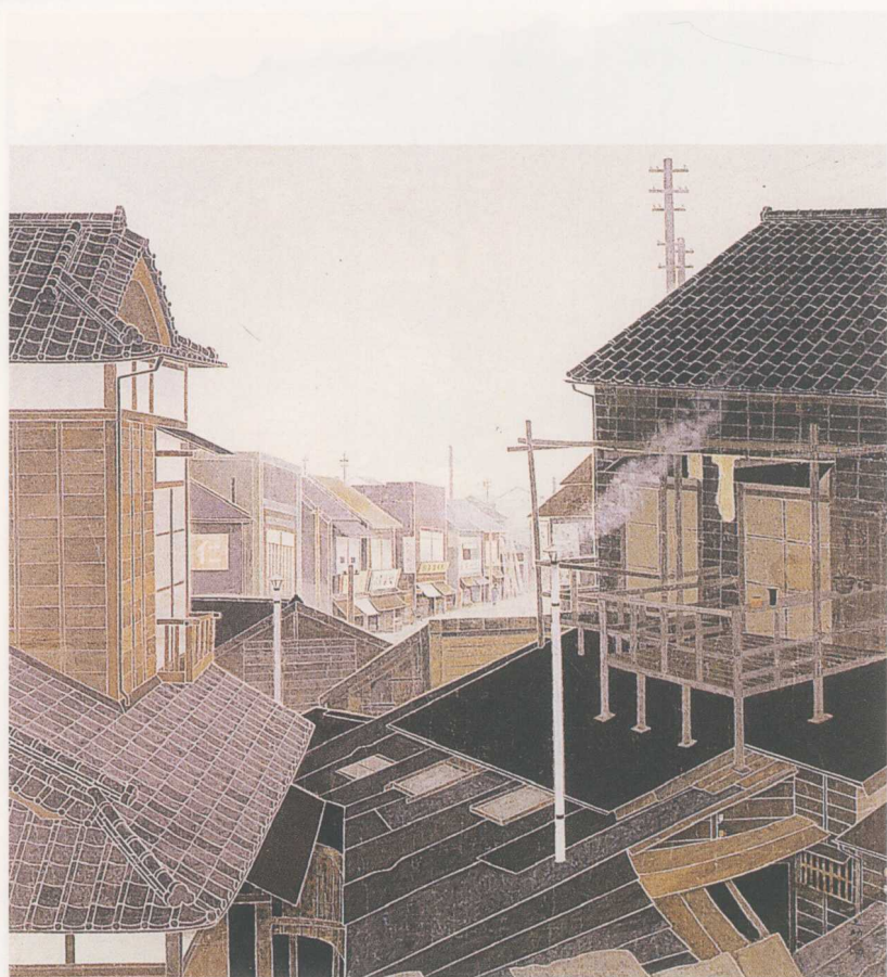
彩圖14 林之助〈冬日〉 1941