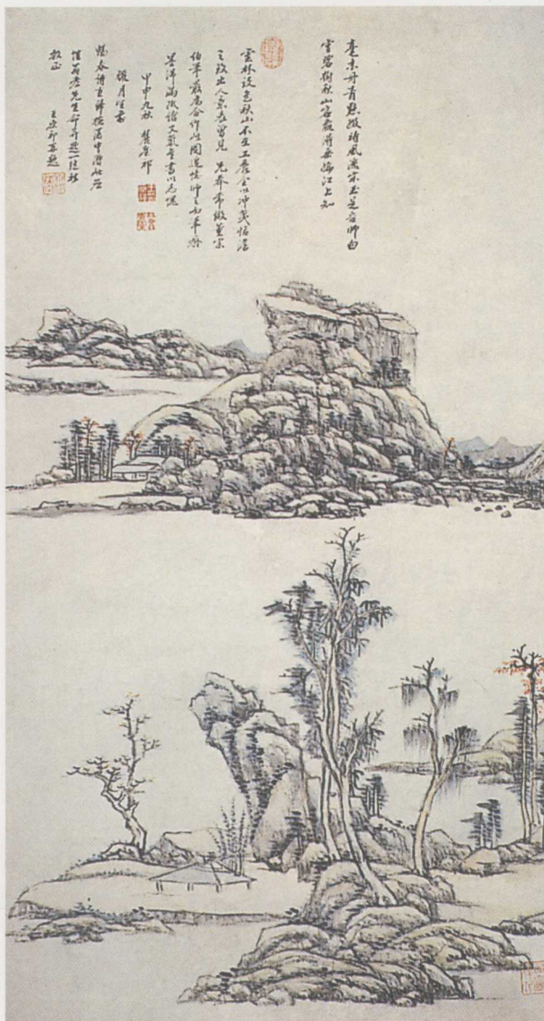
彩圖1 王原祁〈做倪雲林設色秋山軸〉 1705 美國佛瑞爾美術館藏