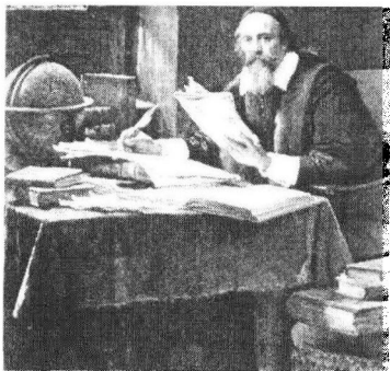
图 1-1 夸美纽斯

1684年,法国天主教神甫拉萨尔(Jean Baptiste de LaSalle, 1651~1719)创立基督教兄弟会 ① ,在他们创办的学校中根据儿童的能力高低编组教学,除了人数多以外,与现代的班级教学制基本相同。因此“拉萨尔分组”被视作是班级教学制的初步形态。