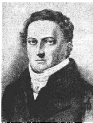
图 1-2 赫尔巴特

德国著名的教育家和心理学家赫尔巴特(J. F. Herbart, 1776~1841,图 1-2)对班级授课制进行了系统的研究,他对班级授课制的主要贡献有两方面。一是对如何处理传授知识和道德培养关系问题上提出了“教育性教学”的概念,认为教育的最高目的是形成道德。二是运用心理学理论研究教学过程,提出了“形式阶段理论”,即①“明了”,清楚、明确地感知教材;②“联合”,在感知的基础上,在个别概念间建立联系,形成各种概念;③“系统”,让各种新旧概念建立更大范围的联系,使知识系统化;④“方法”,通过一定的练习和应用,熟练而牢固地掌握知识。其后,其他学者将第一阶段分为分析、综合两个阶段,赫尔巴特的理论被发展成了著名的“五段论”。这一理论为课的划分和安排,班级稳定地成为学校教育的基本单位奠定了一定的理论基础。三是提出了班级的管理理论,要求建立稳定的规章制度,强调“管理”和